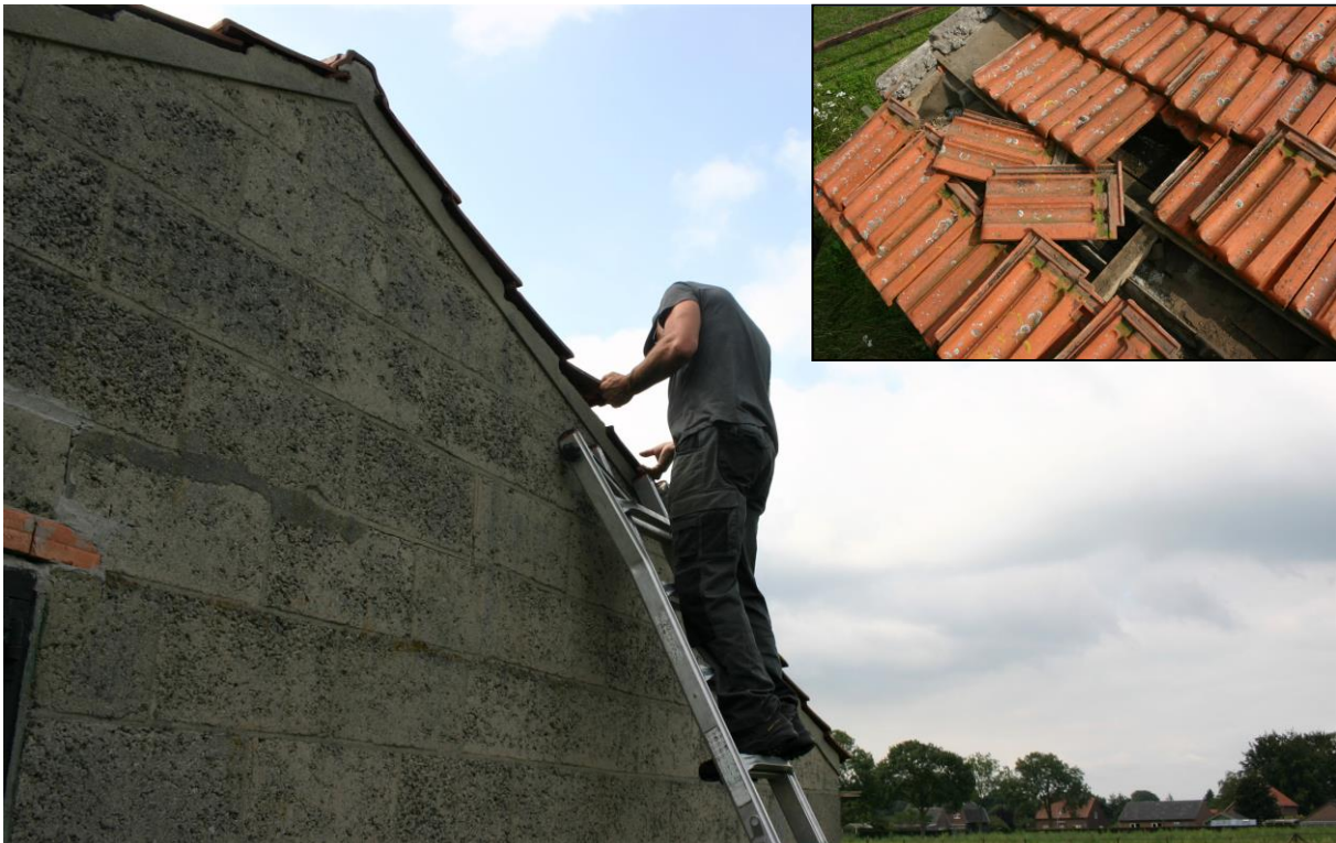
Figuur 4.2.3. Het gehele dak is nauwkeurig geïnspecteerd op de aanwezigheid van steenuilennesten. Hierbij werd onder alle dakpannen gekeken waaronder mogelijk een nest aanwezig kon zijn (zie inzet).

Omdat het schuurtje geschikt oogde als nestlocatie, is het op 23 augustus 2021 nader onderzocht op de aanwezigheid van steenuilennesten (zie figuren 4.2.3). Door de dakconstructie met een ladder, RIGID SeeSnake en zaklamp te inspecteren en her en der dakpannen op te lichten (en terug te leggen).