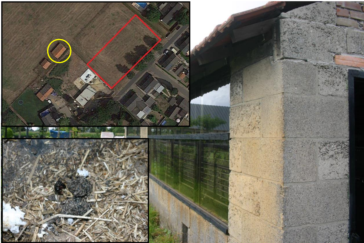
Figuur 4.2.1. In een schuurtje net ten westen van het plangebied (gele cirkel) zijn diverse braakballen van steenuil waargenomen.

Net buiten het plangebied, ten westen ervan, ligt een stenen schuurtje (zie figuur 4.2.1). Hierin zijn tijdens het veldbezoek circa 30 braakballen en enkele uitwerpselen van steenuil waargenomen. De eigenaar van het schuurtje (dhr. Lenssen, woonachtig op Langstraat 22) gaf aan te weten dat er vaker een steenuil in het schuurtje aanwezig is. De aanwezigheid van steenuil werd bevestigd door dhr. Logister (woonachtig op Langstraat 32), die met de achtertuin aan het schuurtje grenst (zie figuur 4.2.2). Beiden gaven aan bij het schuurtje wel eens twee steenuilen waar te nemen.