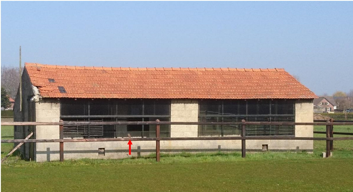
Figuur 4.2.2. Steenuil bij het stenen schuurtje nabij het plangebied. Door het ontbreken van een raam heeft de steenuil vrije toegang tot het gebouw.

Omdat het schuurtje geschikt oogde als nestlocatie, is het op 23 augustus 2021 nader onderzocht op de aanwezigheid van steenuilennesten (zie figuren 4.2.3). Door de dakconstructie met een ladder, RIGID SeeSnake en zaklamp te inspecteren en her en der dakpannen op te lichten (en terug te leggen).