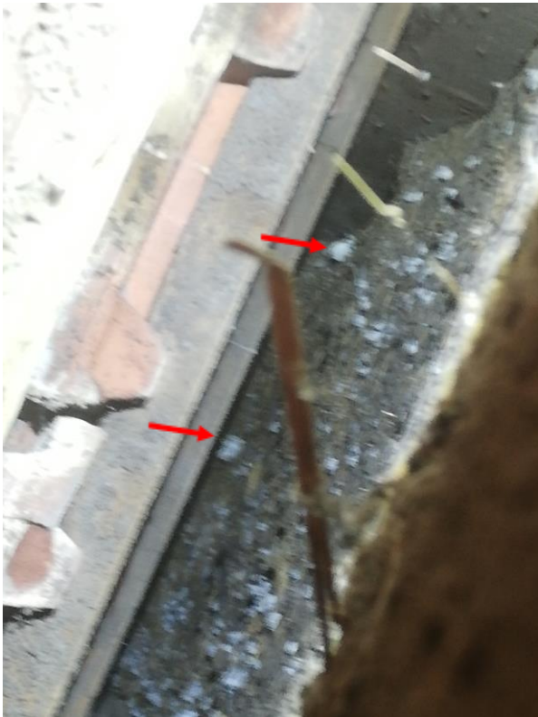
Figuur 4.2.4. Twee uitgekomen steenuileneieren (rode pijlen) in het steenuilennest. De foto is helaas niet erg scherp, maar het gaat hier zeker om steenuileneieren.

steenuilen wordt bereikt. Door het ontbreken van enkele ramen in het schuurtje heeft de steenuil vaste toegang tot het schuurtje en daarmee tot het nest (zie figuur 4.2.6).