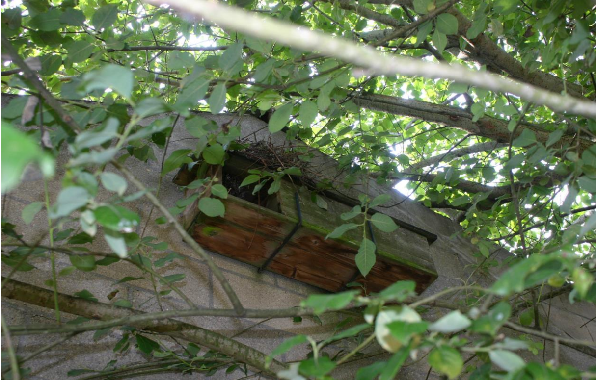
Figuur 4.2.7. De steenuilennestkast aan Bosstraat 28 is niet in gebruik door steenuilen.

Daarnaast werden door de bewoner van Langstraat 32 meermaals ooievaars in en rond het plangebied waargenomen (zie figuur 4.2.8). Nesten van deze soort zijn echter met zekerheid afwezig in het plangebied.