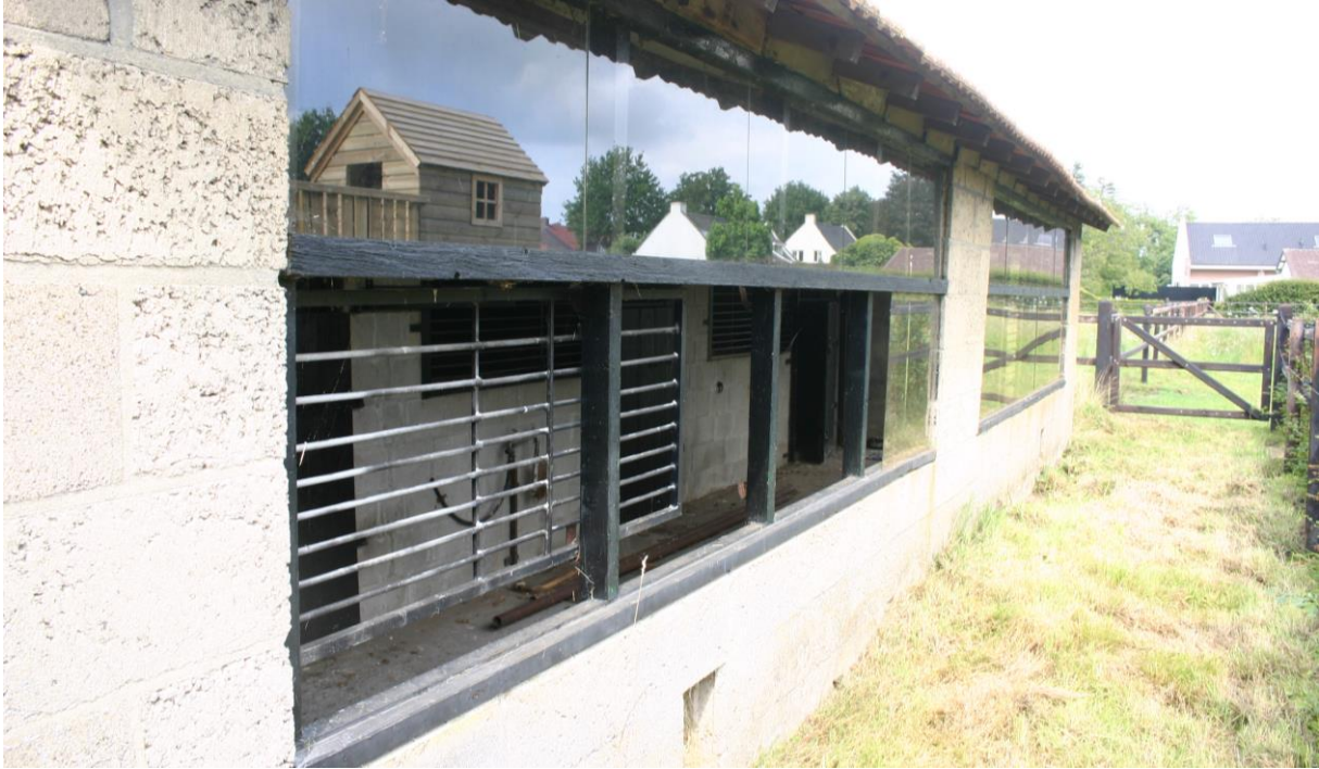
Figuur 4.2.6. Door enkele gebroken ruiten heeft de steenuil permanent toegang tot het stenen schuurtje.

Wegens de aanwezigheid van een nestplaats van de steenuil, ligt het voor de hand dat de begraasde ponywei rond het stenen schuurtje als (deel van het) foerageerhabitat van de steenuil functioneert.