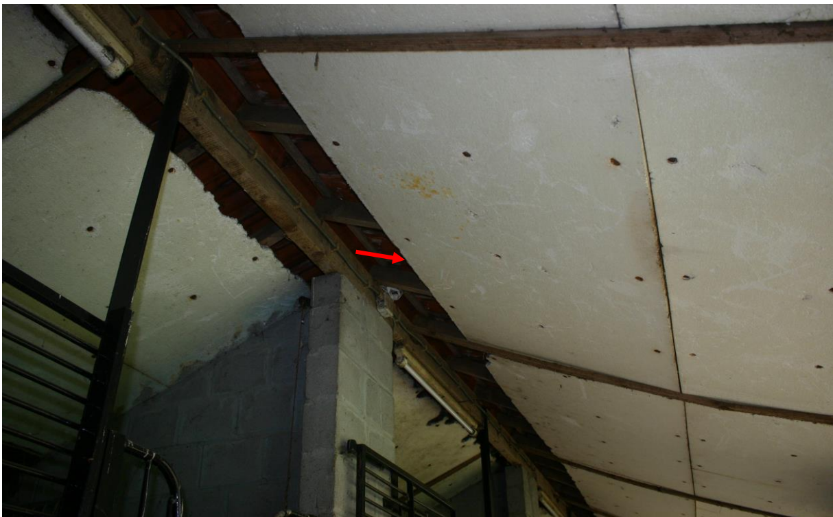
Figuur 4.2.5. Ingang tot het steenuilennest (rode pijl).