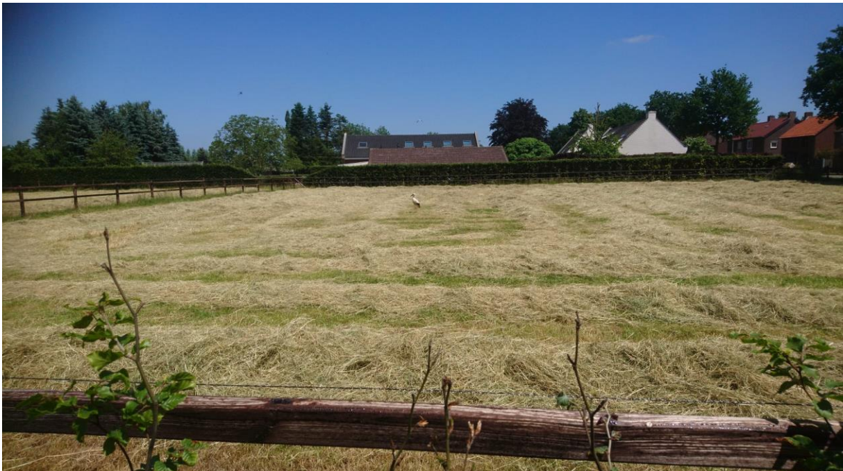
Figuur 4.2.8. Ooievaar direct naast het plangebied.

Daarnaast werden door de bewoner van Langstraat 32 meermaals ooievaars in en rond het plangebied waargenomen (zie figuur 4.2.8). Nesten van deze soort zijn echter met zekerheid afwezig in het plangebied.