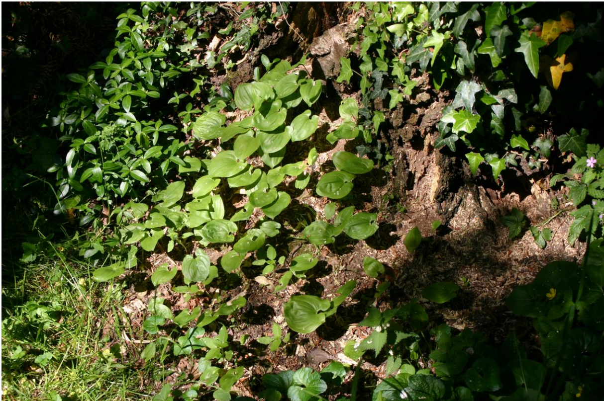
Figuur 3. Dalkruid (niet beschermd) in de achtertuin van Berkelstraat 7.

In het plangebied zijn tijdens het veldbezoek alleen algemene, niet beschermde planten waargenomen (zie paragraaf 4.1; figuur 3). De Provincie Limburg heeft het kilometerhok waarin het plangebied ligt in 2002 (onvolledig) onderzocht op het voorkomen van beschermde of bijzondere planten ( http://www.natuurgegevensprovincielimburg.nl ). Beschermde plantensoorten waren in en rond het plangebied afwezig.