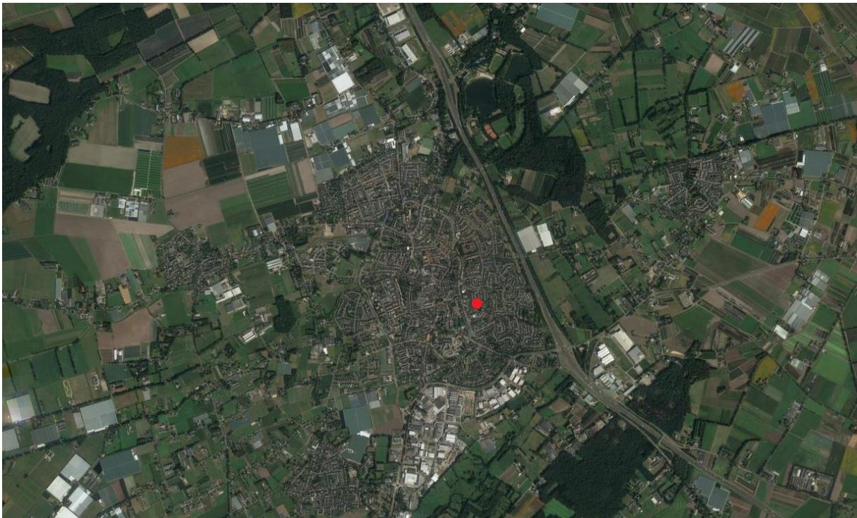
Figuur 1. Ligging van het plangebied in Horst (rode stip).

Pijnenburg begeleidt de bouw van twee woningen op een locatie aan Het Veldje te Horst (zie figuur 1) en heeft Faunaconsult opdracht gegeven een flora- en fauna-inspectie uit te voeren. De voorgenomen ontwikkeling heeft aanleiding gegeven voor deze inspectie. Hierin is nagegaan welke effecten de ingreep heeft op lokaal voorkomende beschermde flora en fauna. Het risico bestaat dat het plangebied deel uitmaakt van leefgebieden van diverse beschermde soorten. Dit document geeft inzicht in de mogelijke knelpunten in het kader van natuurwetgeving en -beleid en mogelijke effecten als gevolg van het project.