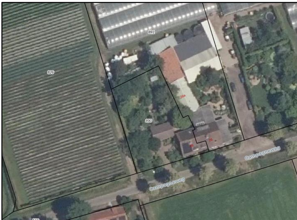
Afbeelding 1: luchtfoto bestaande situatie Campagneweg 28 (perceel 890)

In de bestaande situatie is het perceel reeds landschappelijk ingepast in de omgeving. Omdat er reeds in ruime mate groen (zie luchtfoto in afbeelding 1) op het perceel aanwezig is, wordt in onderhavig plan vastgelegd dat het bestaande groen behouden zal blijven. Verder toevoegen van groen levert geen extra kwaliteitsverbetering op.