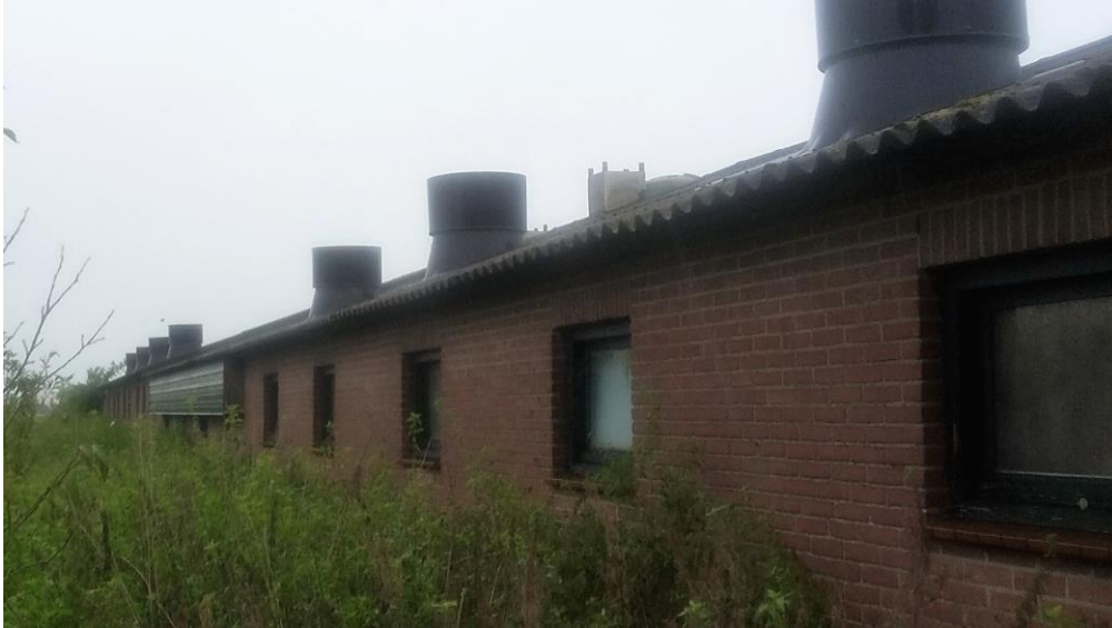
Figuur 4. Westelijk gelegen varkensstal (gebouw 1 in figuur 3).