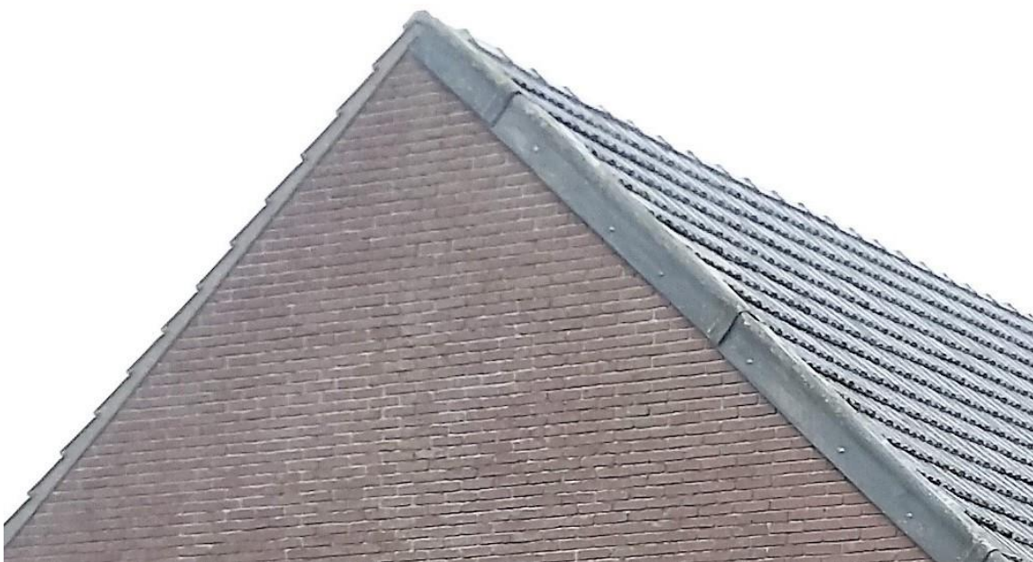
Figuur 9. De dakpannen liggen op de gevel in cement en aan één zijde bevinden zich daarnaast eternieten platen (gevel van de schuur aan de stalzijde). Pm de eternieten platen kieren iets met de muur.