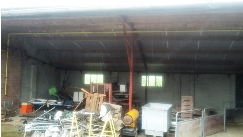
Figuur 5. De open opslagruimte (gebouw 3 in figuur 3).