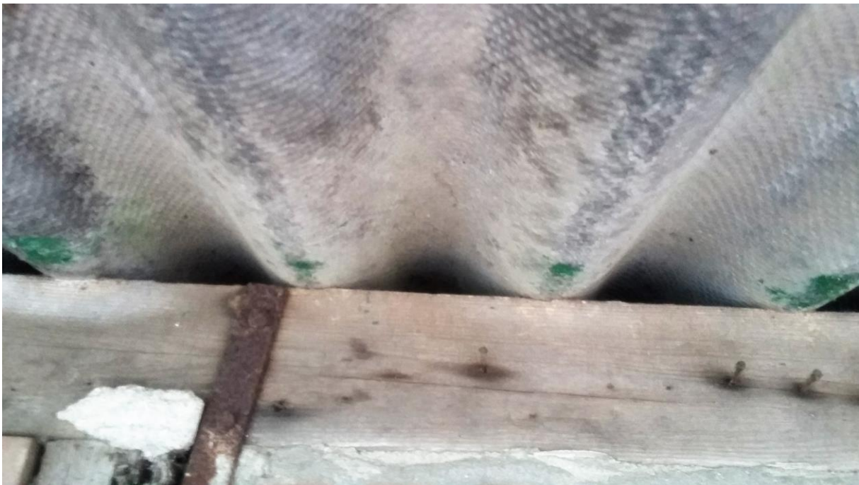
Figuur 7. Eternieten golfplaten op het dak van de varkensstallen.

De varkensstallen hebben gemetselde muren met daarop een dak van eternieten golfplaten (zie figuur 7). De ruimten onder de ‘golven’ van deze golfplaten zijn te tochtig om als vleermuisverblijf te dienen. De muren hebben geen open stootvoegen en er is een gevelplaat op de spouw (zie figuur 7), zodat vleermuizen de spouw niet kunnen bereiken. Daarnaast beschikt de westelijk gelegen varkensstal over een ventilatiesysteem waarbij lucht in de spouw circuleert (dit ventilatiesysteem is te zien op de grote foto op de voorzijde van dit rapport). Door de luchtstroom in de spouw zijn hier geen vleermuisverblijven te verwachten. Wegens de aanwezigheid van een sterke varkenslucht zijn vleermuizen sowieso niet in beide stallen te verwachten. De stallen zijn tijdens het veldbezoek van binnen geïnspecteerd en hierbij werden geen sporen van vleermuizen of andere beschermde dieren aangetroffen.