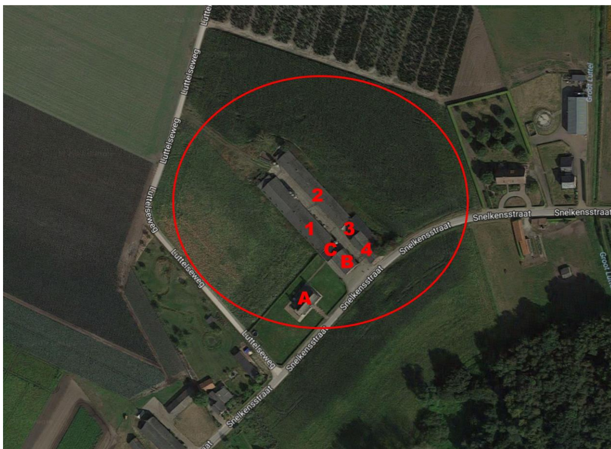
Figuur 3. Globale ligging van het plangebied (rood omlijnd). De letters hebben betrekking op gebouwen die behouden blijven; de cijfers op gebouwen die gesloopt worden. Voor verdere uitleg zie tekst.

Daarnaast is er een woonhuis aanwezig (A in figuur 3) en een schuur met het opschrift 'Pulle Plats' (B in figuur 3 en kleine foto linksboven op de voorzijde van dit rapport). C in figuur 3 bestaat uit onder meer een carport en een stenen aanbouw. A, B en C blijven alle behouden en vallen dus buiten het plangebied.