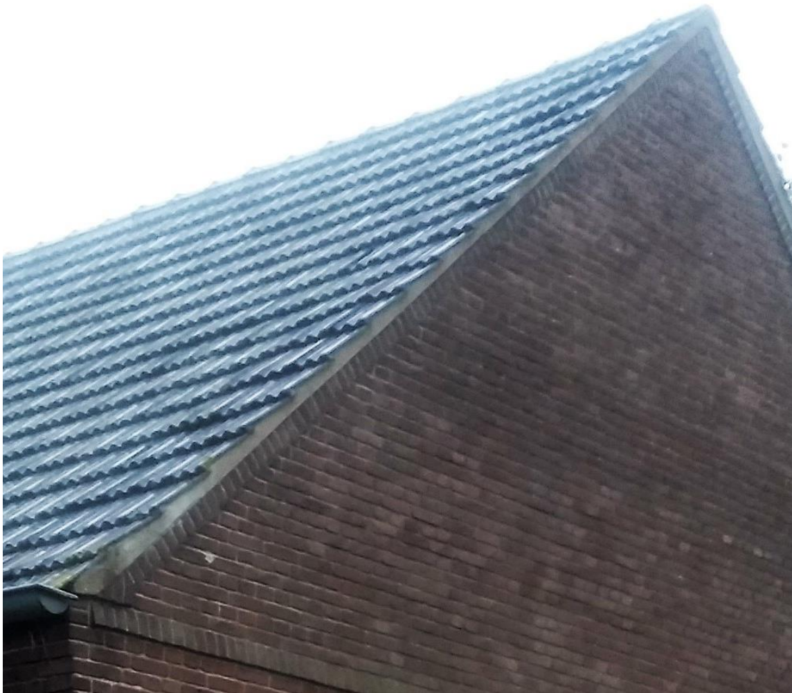
Figuur 8. De dakpannen liggen op de gevel in cement (gevel van de schuur aan de straatzijde).