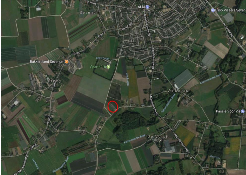
Figuur 1. Globale ligging van het plangebied.

In het plangebied worden 2 nog in gebruik zijnde varkensstallen gesloopt, evenals een schuur en een open opslagruimte. Vervolgens worden hier 2 woningen gebouwd. Figuur 1 geeft de ligging van het plangebied, figuur 2 geeft de voorgenomen situatie weer.