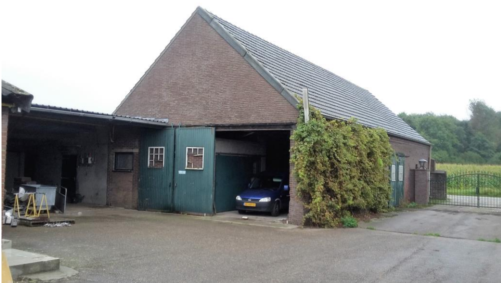
Figuur 6. De schuur (gebouw 4 in figuur 3) en een deel van de open opslagruimte.