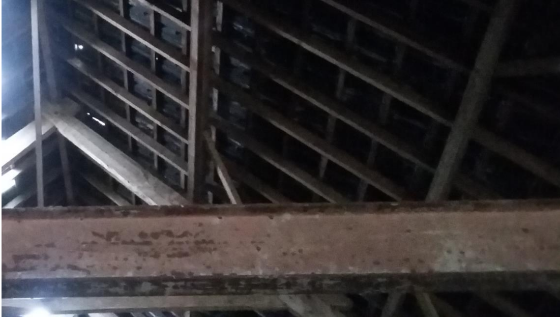
Figuur 10. De schuur heeft een enkelwandig dak.

De boom en struiken in het plangebied bevatten geen holten of nesten, zodat hierin geen verblijven van vleermuizen, eekhoorns of andere strenger beschermde zoogdieren aanwezig zijn.