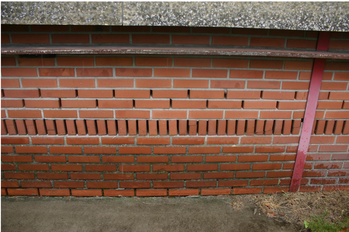
Figuur 4.2.2. De spouwen zijn veel te open en te tochtig voor vleermuizen. Bovendien bevinden de openingen in de buitengevels zich erg laag bij de grond.