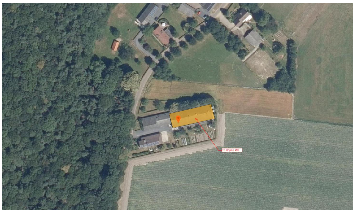
Figuur 4.1. Het plangebied (oranje rechthoek en rode marker).

De omgeving rond het plangebied is deels agrarisch en deels als bosgebied ingericht. Het plangebied grenst aan de noord- en oostzijde aan een akker. De zuidzijde grenst aan een moestuin en ten westen van het plangebied bevindt zich een varkensstal (waartegen de in het plangebied gelegen varkensstal is aangebouwd; beide liggen aan de Sint Maartensweg 7).