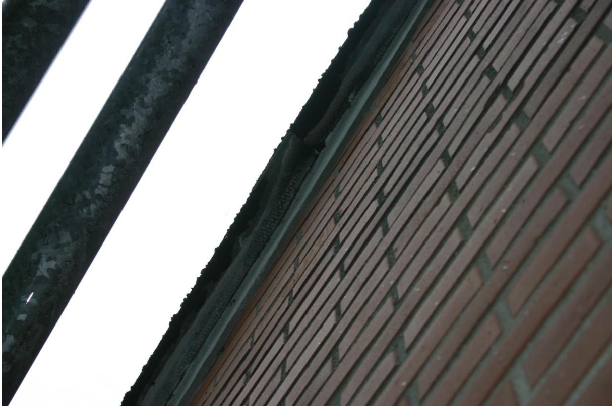
Figuur 4.2.1. Beide kopgevels zijn bovenaan afgestreeken met specie, zodat de ruimte tussen de golfplaten en de buitengevel gedicht is. Vleermuizen kunnen hier dus niet de spouw in.