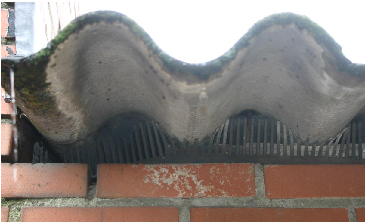
Figuur 4.2.3. Onder de golfplaten is vogelschroot aanwezig.

Onder de ‘golven’ van het golfplaten dak is vogelschroot aanwezig. De binnenzijde van het te slopen deel van de varkensstal (en het aangrenzende deel, dat niet wordt gesloopt) is volledig geïnspecteerd. Vogelnesten, (resten van) eierschalen, veren etc. zijn hier afwezig. Het is wel mogelijk dat algemene vogelsoorten als merel in het broedseizoen in de opgaande vegetatie rond het plangebied (gaan) broeden.