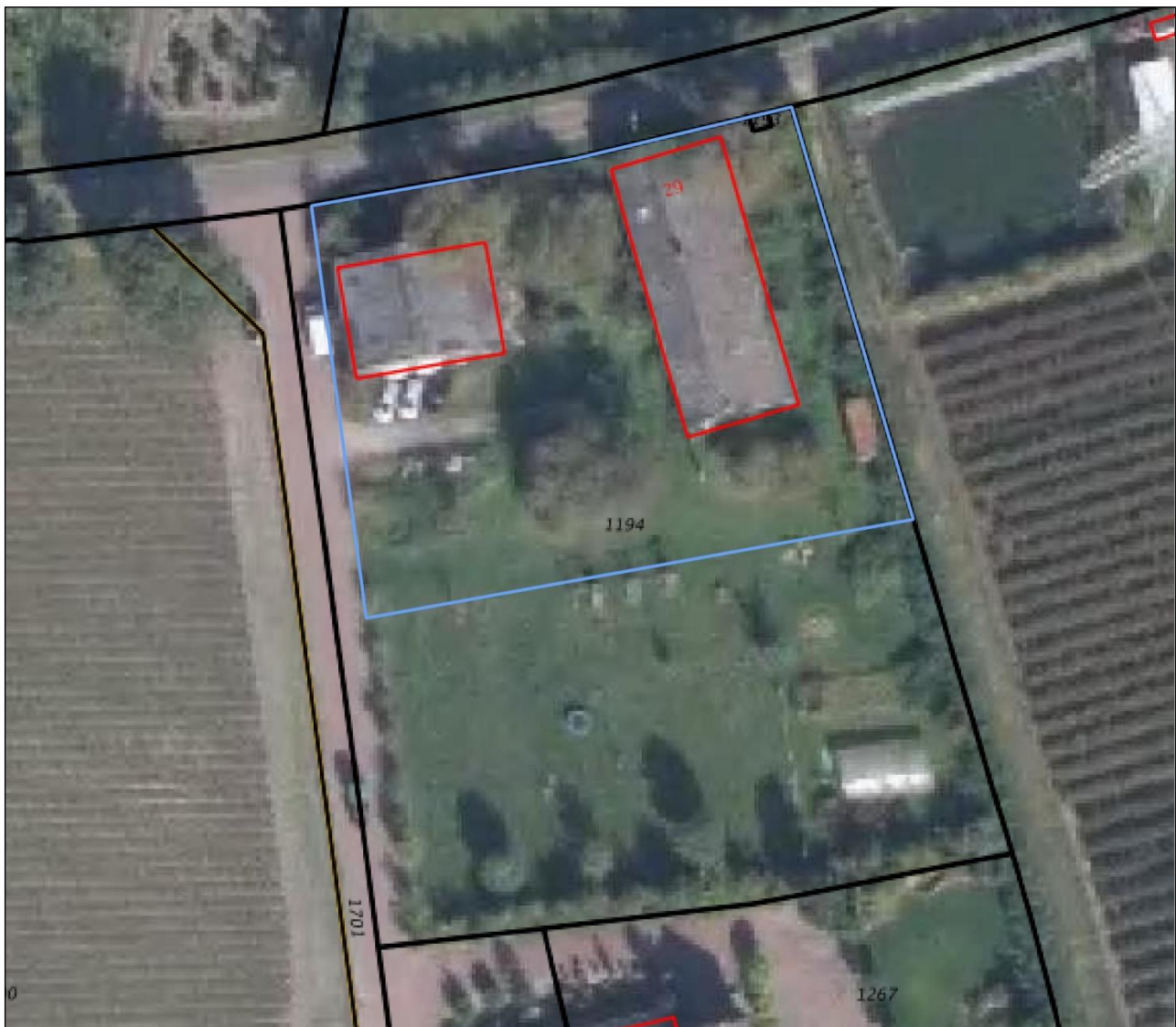
Figuur 1: Kadastrale indeling met daarop het bouwvlak