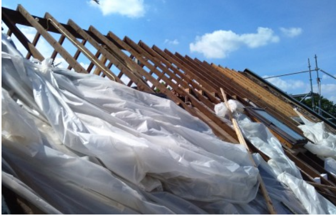
toelichting foto: plaats waar is gesaneerd - folie tijdens inspectie laten verwijderd