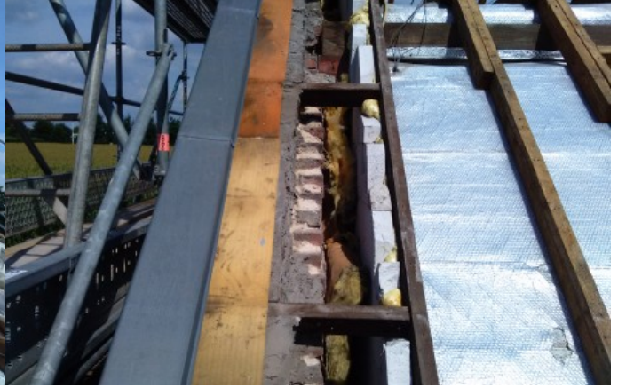
toelichting foto: spouwmuur uitgesloten van inspectie