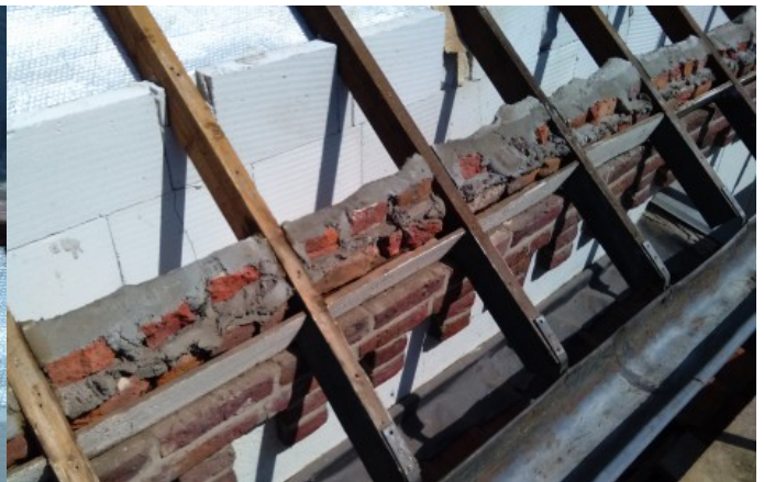
toelichting foto: plaats waar is gesaneerd