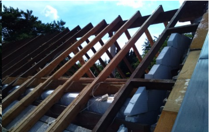
toelichting foto: plaats waar is gesaneerd