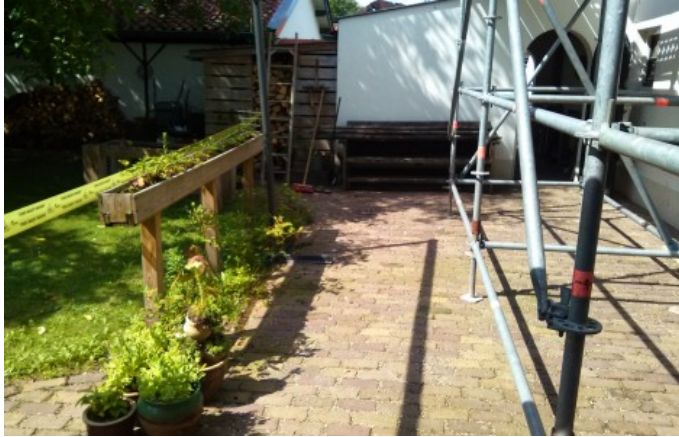
toelichting foto: afzetlint - steiger