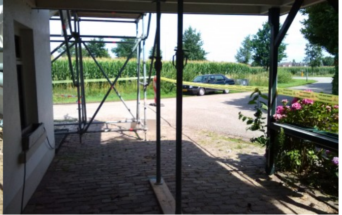
toelichting foto: afzetlint - steiger