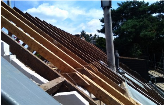
toelichting foto: plaats waar is gesaneerd