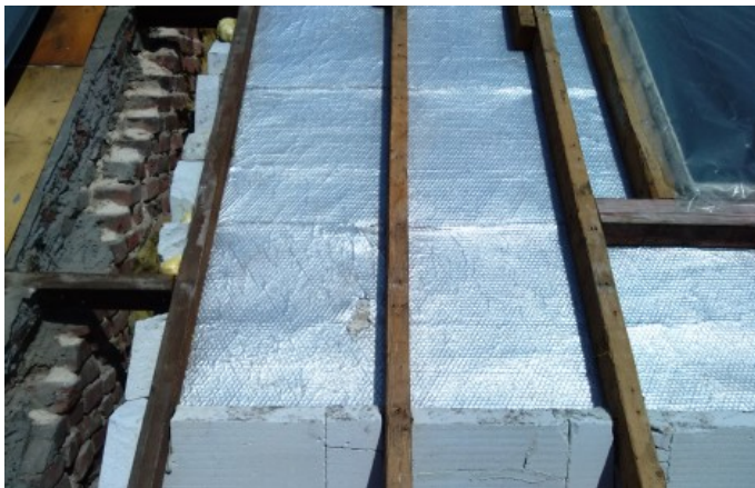
toelichting foto: plaats waar is gesaneerd