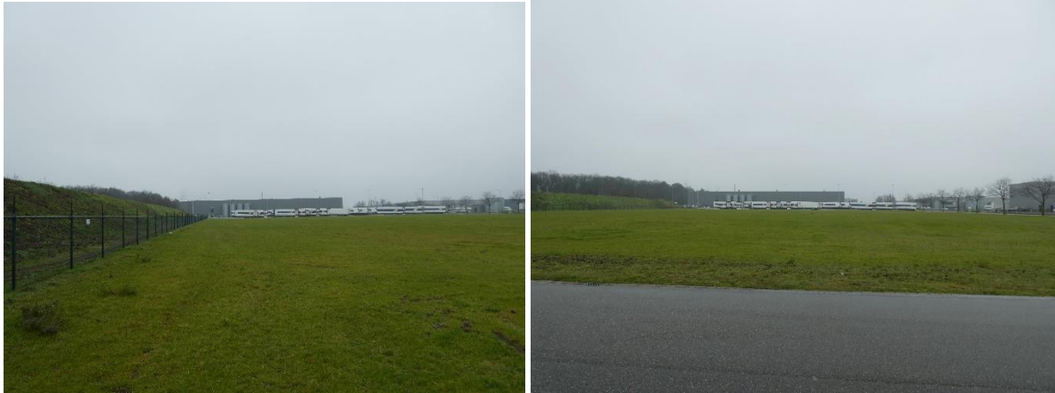
Afbeelding 3 en 4: de te ontwikkelen kavels.