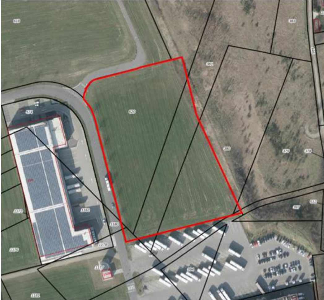
Afbeelding 2: De kavels waarbinnen de werkzaamheden plaats gaan vinden, binnen de rode lijnen.