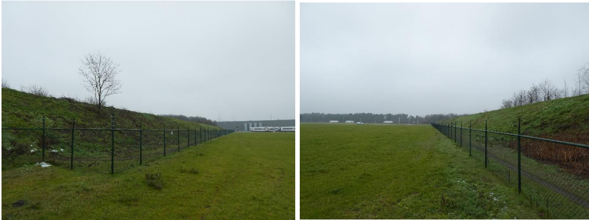
Afbeelding 7 en 8: De aangrenzende beplantingen nabij de te ontwikkelen kavels.