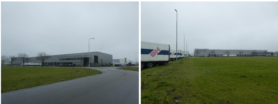
Afbeelding 5 en 6: aangrenzende bebouwing ten zuiden en westen van de te ontwikkelen kavels.

Aangrenzend aan de te ontwikkelen kavel is bebouwing aanwezig (zie afbeelding 5 en 6). Beoordeeld moet worden of geplande werkzaamheden een negatief effect kunnen hebben op mogelijk aanwezige beschermde soorten flora en fauna in de aangrenzende bebouwingen.