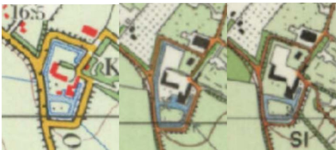
Figuur 8 - Het kasteelterrein in 1980, 1990 en 1993. In 1980 waren alle grachten nog aanwezig. In 1990 is de noordoosthoek gedempt. In 1993 zijn alle grachten, behalve die rondom de voorburcht, gedempt.

Het kasteel met aan- en bijgebouwen vormt tegenwoordig het centrum van een recreatieterrein. Het kasteel zelf was oorspronkelijk bedoeld voor verhuur van appartementen voor recreatiedoeleinden. Thans wonen er arbeidsmigranten. De bijgebouwen zijn in gebruik voor het recreatiepark waar ze bij behoren.