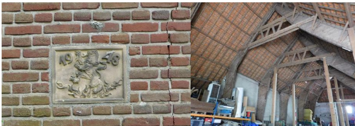
Figuur 6 - Jaartalsteen in de schuur (1948); behalve het jaartal bevat de steen ook de klimmende Nederlandse leeuw, het symbool van herrijzend Nederland. Rechts daarvan is een van de vele scheuren in het metselwerk te zien. De rechter foto toont het interieur van de wederopbouwschuur.

Bijzonder is de grote schuur achter op het complex. Dit betreft een schuur uit de wederopbouwperiode (1948) in de toen gebruikelijke traditionele stijl. Bijzonder is het feit, dat er spanten zijn gebruikt die afkomstig zouden zijn van het Duitse leger. Het betreft standaard houten spanten voor vliegtuighangars. Door gebrekkig onderhoud en waarschijnlijk overbelasting zijn de spanten doorgezakt, waardoor er lekkages ontstonden en door inwatering nog meer schade ontstond. De meeste spanten zijn inmiddels zodanig verrot, dat deze onherstelbaar zijn. Door het deformeren van het dak zijn ook delen van het muurwerk onder spanning komen te staan en gescheurd.