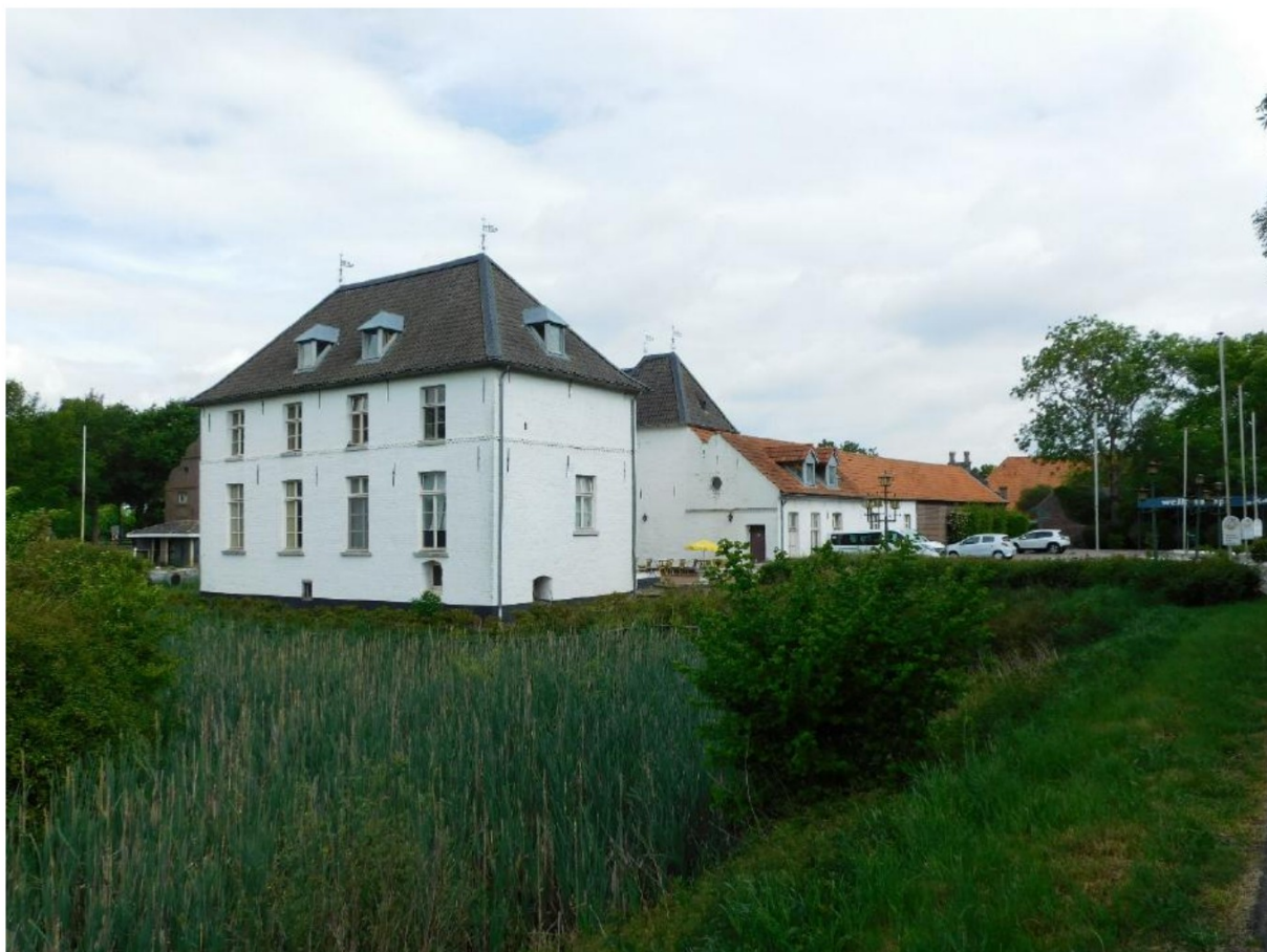
Figuur 4 - Het kasteel van Ooijen tegenwoordig (foto 13 05 2022); links vooraan het oudste gedeelte uit de 15 e -17 e eeuw; daarachter onder het schilddakje met donkere pannen de torenbouw uit de 17 e eeuw; rechts daarvan de vleugel met economiegebouwen uit de negentiende eeuw. De gracht op de voorgrond is in hoge mate dichtgegroeid met riet.