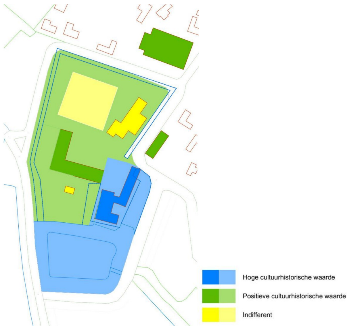
Figuur 10 - Cultuurhistorische waardering gebied Kasteel Ooijen; De gebouwen zijn vol gekleurd, terreinen en ongebouwde objecten zijn zacht gekleurd.

Op basis van het onderzoek wordt gekomen tot de volgende waardering van de afzonderlijke onderdelen en terreinen. Let wel: het gaat hier niet om de bouwkundige kwaliteit, de restaureerbaarheid of de landschappelijke waarde, maar uitsluitend om de cultuurhistorische waarde, zoals die meegewogen moet worden in de evenredige belangenafweging, zoals die ten grondslag gaat liggen aan de in het bestemmingsplan op te nemen bestemmingen.