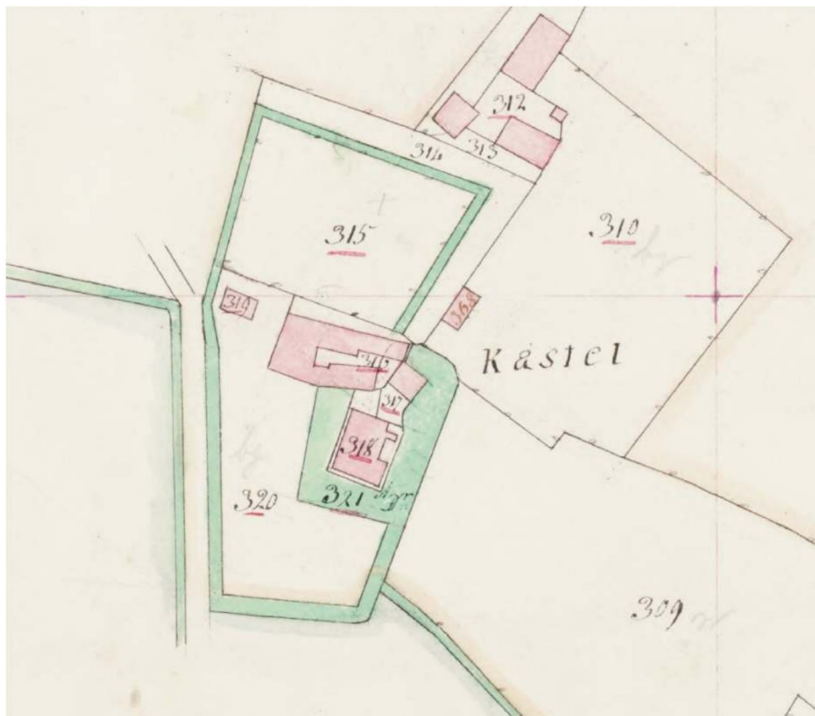
Figuur 3 - kadastraal minuutplan (detail) (1821) Commune de Broekhuysen Section A, dite Oeyen, deuxième feuille, levee par J.J. Cremers, geometre de 1er classe.

De Ooijense tak van de familie ██████████ bezat zowel het kasteel als 2/3 van de heerlijkheid. 8 Al in 1375 werd er een 'Heer van Ooijen' genoemd. In 1396 werd voor het eerst het kasteel van Ooijen genoemd. Dit zal een eenvoudige woontoren zijn geweest, waarvan de mergelfundering nog deels aanwezig zijn. 9