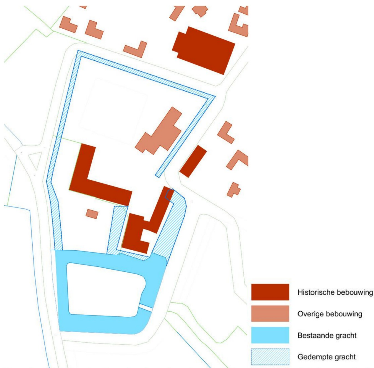
Figuur 9 - De huidige situatie van het kasteelterrein; een deel van de grachten is in de negentiende eeuw, een ander deel is in de jaren vlak na 1990 gedempt.

Aan de zuidzijde van het kasteel bevindt zich een omgracht terrein, mogelijk de voormalige voorburch van het kasteel. Het omgrachte terrein was eens toegankelijk via een houten brug, maar deze is in een dermate slechte staat, dat de overgang niet langer veilig is. Gracht en voorterrein waren op het kadastrale minuutplan al aangegeven. Ook de rest van het kasteelterrein was in het begin van de negentiende eeuw omgracht. Sterker, uit Figuur 8 blijkt, dat in 1980 vrijwel het gehele grachtencomplex nog aanwezig was. Blijkbaar zijn de meeste grachten in het begin van de jaren 90 gedempt. De bestaande gracht wordt gevoed door de naamloze waterloop uit zuidoostelijke richting.