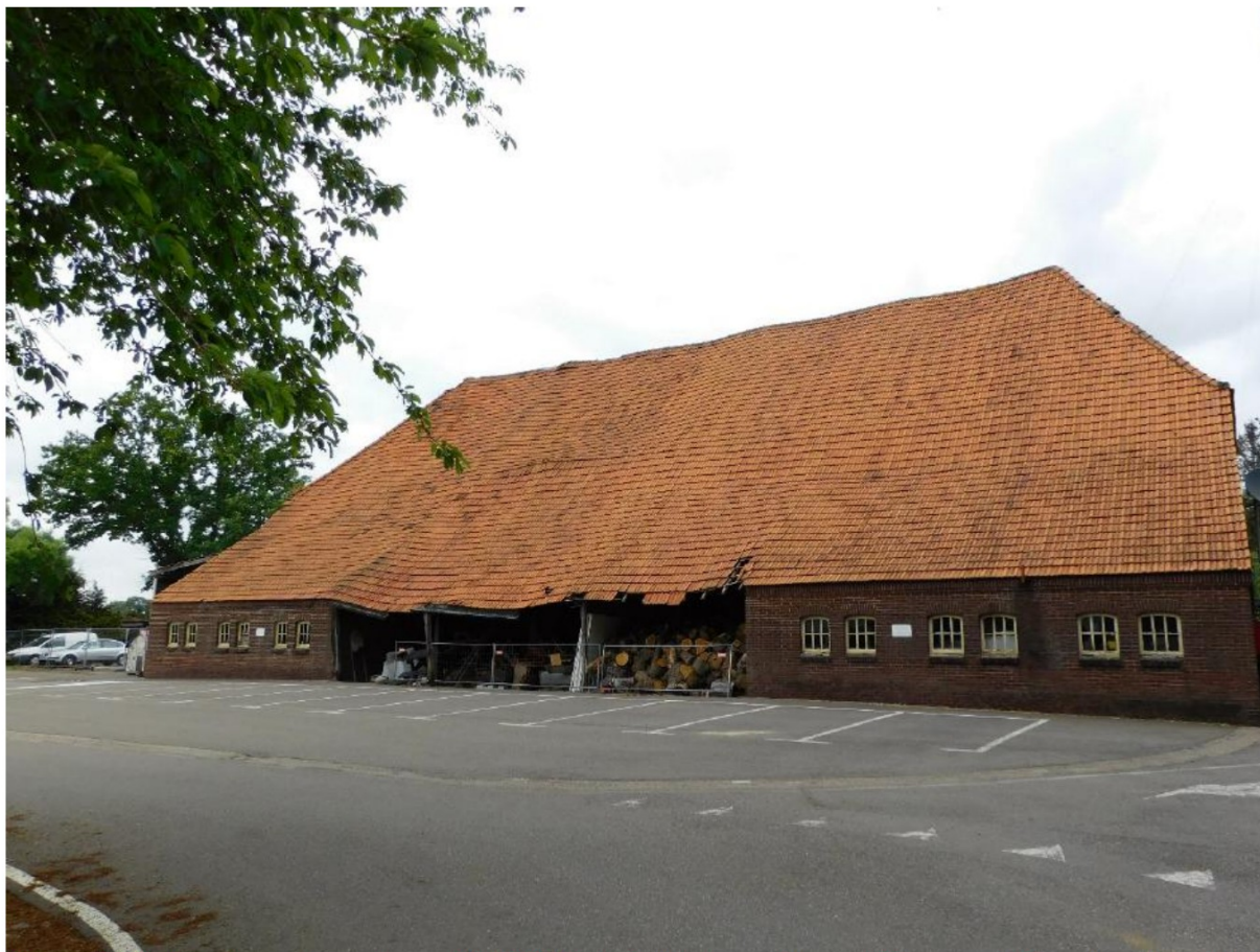
Figuur 7 - Schuur in wederopbouwstijl (1948); het dak is ernstig gedeformeerd. Daardoor is ook het muurwerk deels beschadigd.