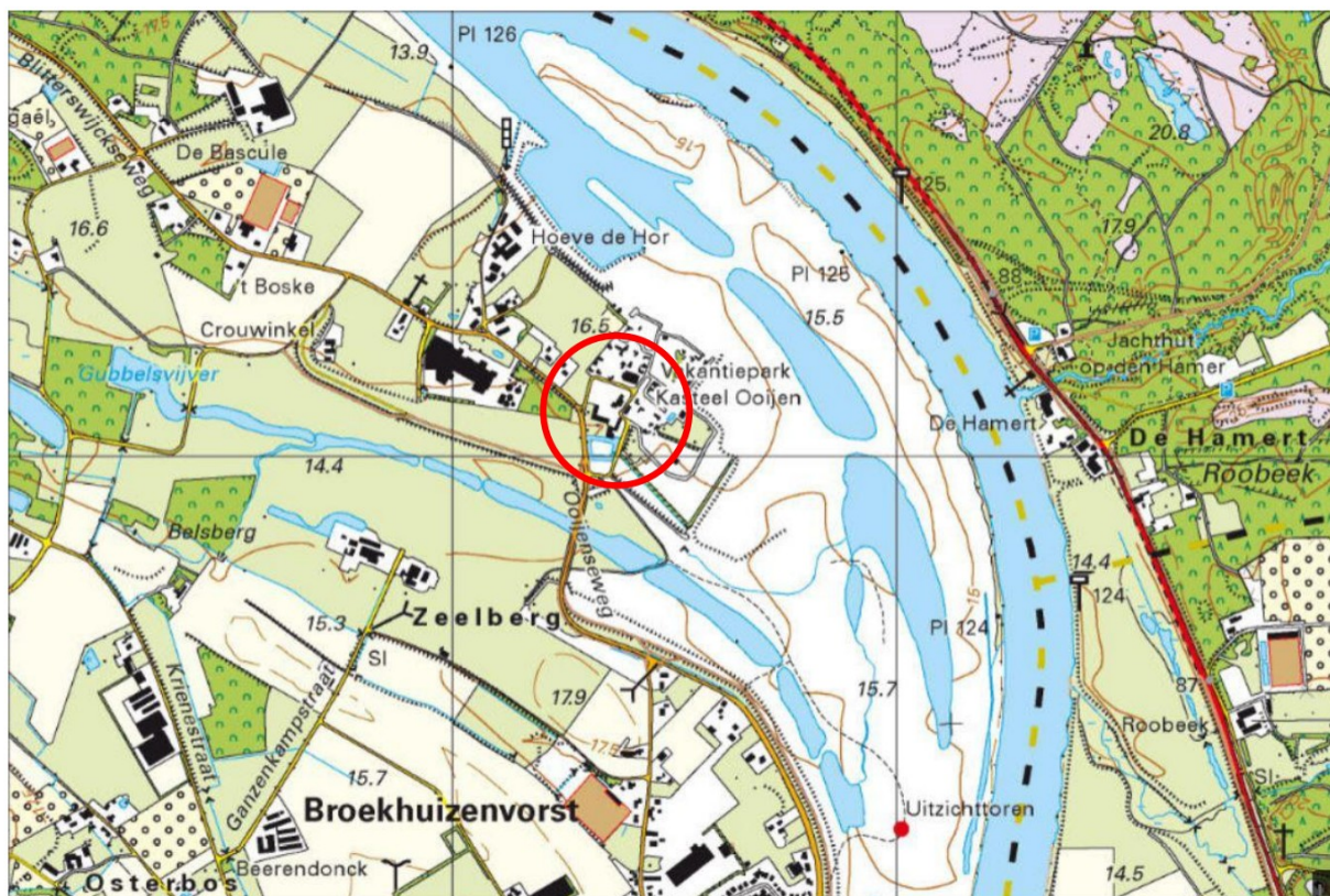
Figuur 1 - Situatie van het studiegebied (topografische kaart 2021); het studiegebied is gelegen binnen de rode begrenzing.