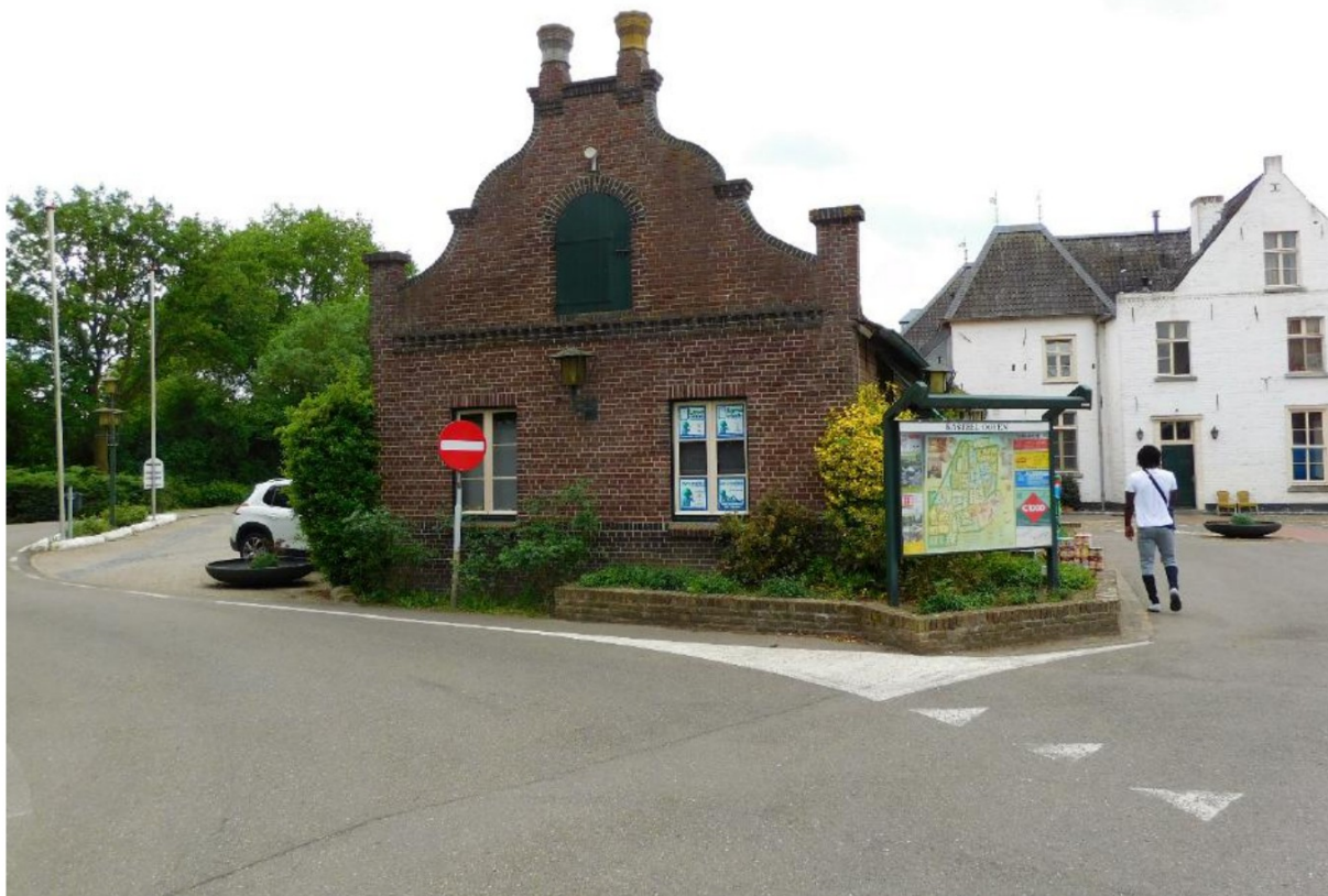
Figuur 5 De negentiende-eeuwse vleugel van het kasteel met in- en uitgezwente topgevel waarschijnlijk uit 1926.

Op het terrein staat ook een open karrenschuur met houten gebinten in traditionele vorm.