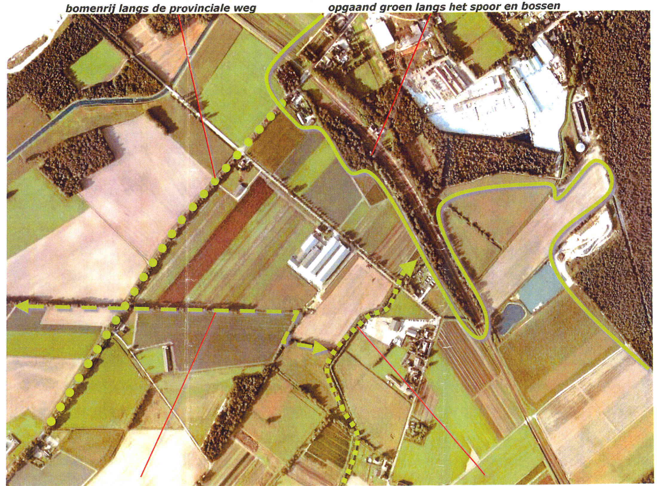
de oost-west verlopene singel opgaand groen langs de Rijnbroeker loop

Het ruimtelijke kader wordt gevormd door de bomen langs de Provinciale weg (de N554), het opgaande groen langs het spoor en de daarachtergelegen bossen, de oost-west verlopene singel en de recenter gerealiseerde opgaande beplanting langs de Rijnbroeker loop. Het landschapskader Noord- en Midden-Limburg rangschikt het gebied in kaart 5, de kwaliteitsimpuls in een zone voor het versterken van variatie in de schaal van de ruimte door het ontwikkelen van bouselementen en groenstructuren.