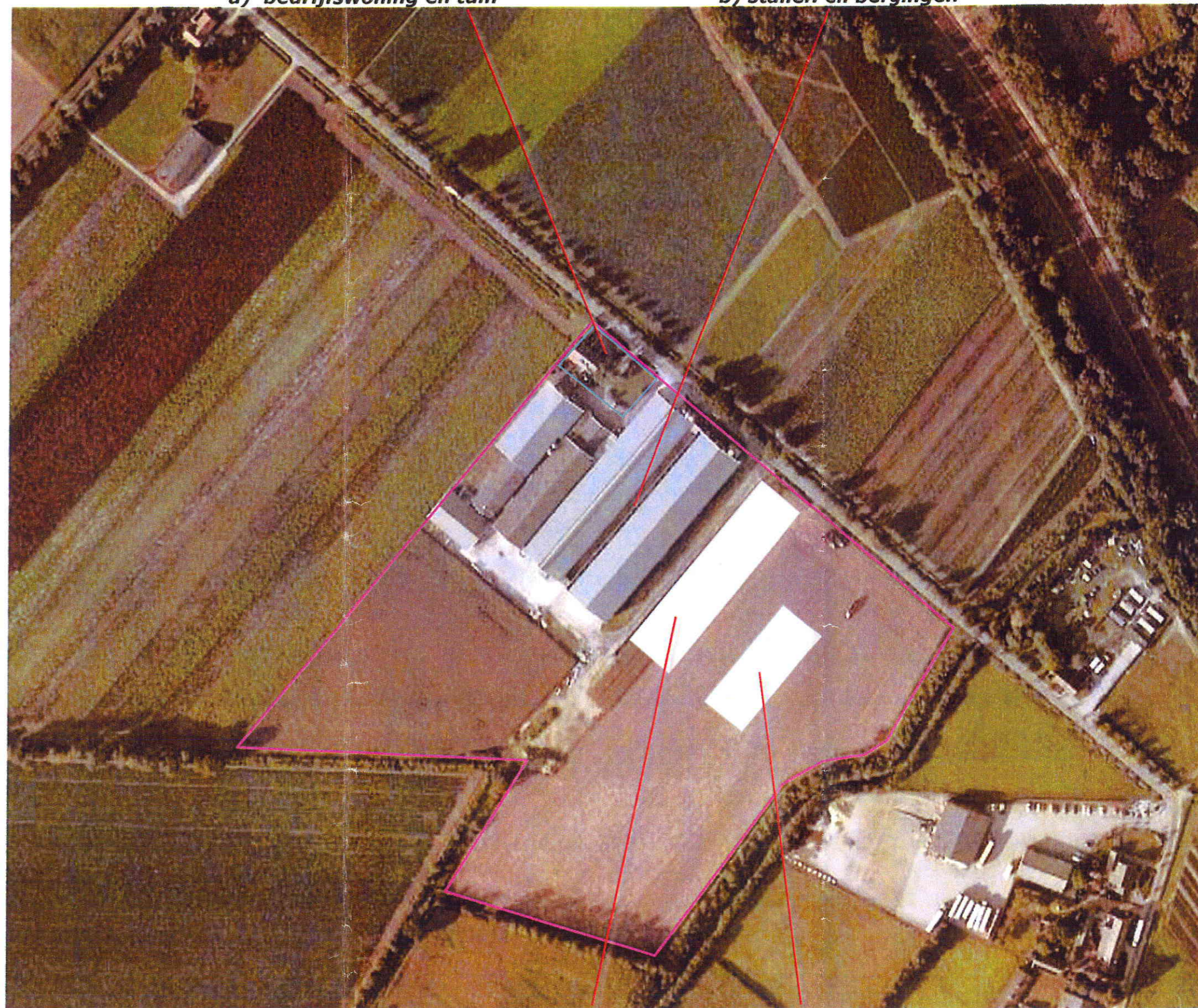
te realiseren leghennenstal en graanloods