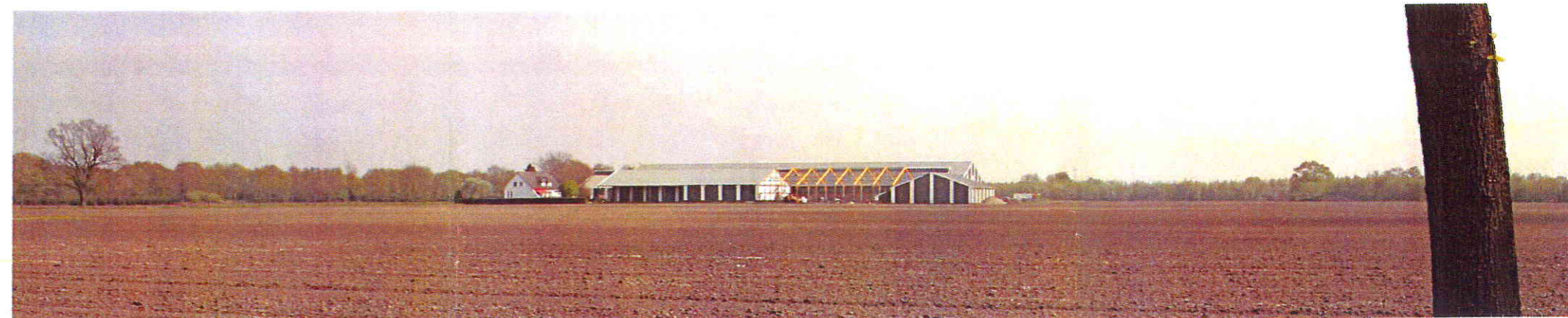
zicht vanaf de Provinciale weg