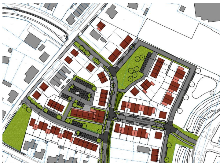
Figuur 2: Voorlopig stedenbouwkundig ontwerp (d.d. 07-03-2022)