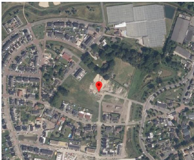
Figuur 1: Luchtfoto plangebied

Onder regie van gemeente Horst aan de Maas wordt momenteel de volgende fase ontwikkeld. Het voornemen is om op de beoogde locatie Afdeling fase D te Horst 73 woningen te realiseren.