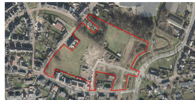
Figuur 2: Luchtfoto plangebied en directe omgeving