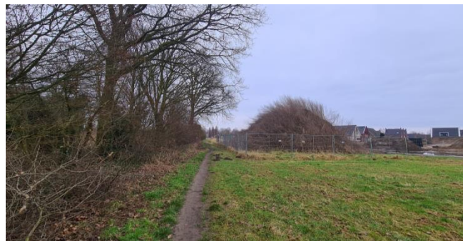
Figuur 8: Plangebied gezien vanuit het westen