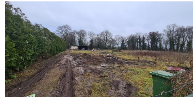
Figuur 6: Verloederde uitloopweide in het noordoosten van het plangebied