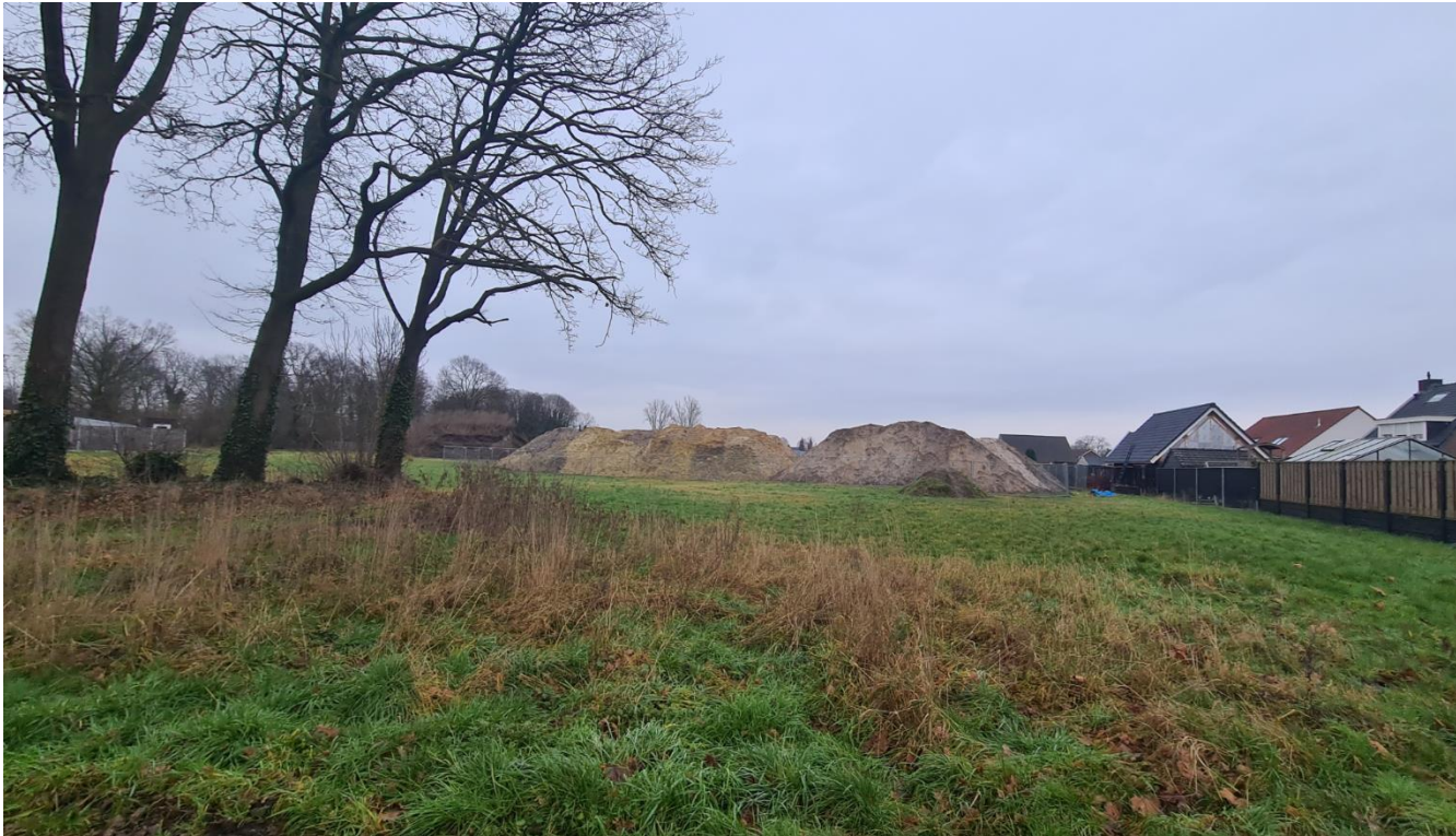
Figuur 4: Plangebied gezien vanuit het westen