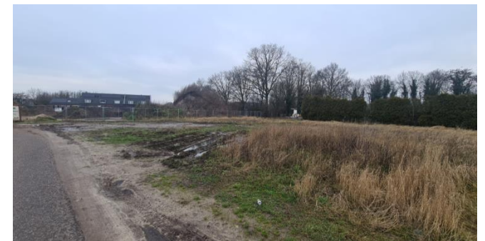
Figuur 9: Plangebied gezien vanuit het oosten