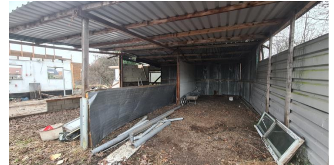
Figuur 5: Schuur in het noordoosten van het plangebied