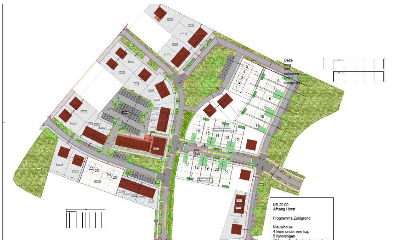
Figuur 3: Toekomstige situatie plangebied