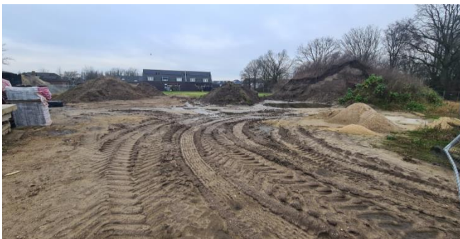
Figuur 7: Midden van het plangebied