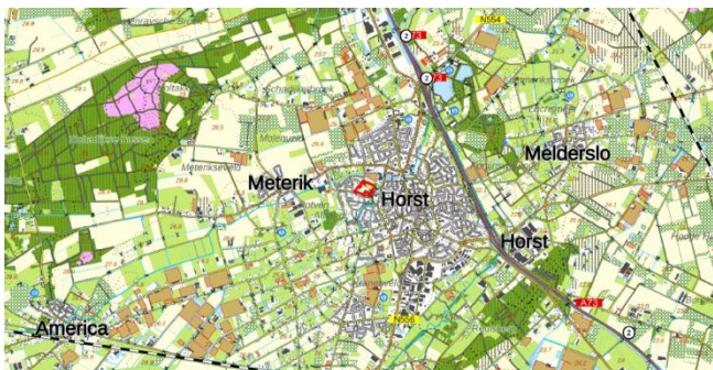
Figuur 1: Topografische kaart ligging plangebied (1:25.000)

De initiatiefnemer is voornemens 80 woningen te realiseren. Er zijn zowel levensfasebestendige woningen, rijwoningen en twee onder een kap woningen beoogd. Daarnaast zal de benodigde infrastructuur worden aangelegd. Figuur 3 geeft een beeld van de toekomstige situatie.