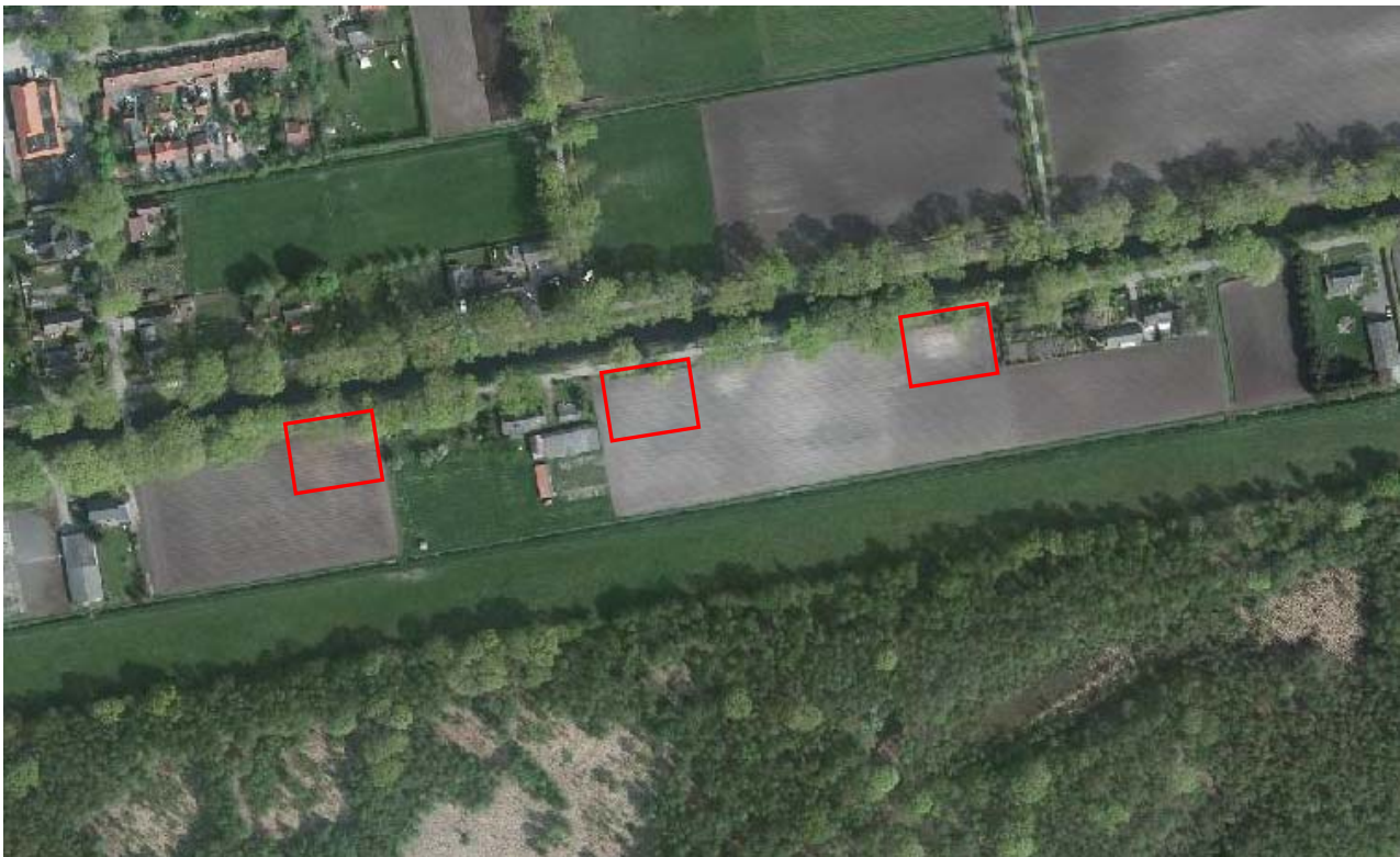
Afbeelding 1: Globale begrenzing onderzoekslocaties

Op onderstaande luchtfoto is de globale begrenzing van de onderzoekslocatie (kavels 3, 4 en 5) weergegeven. Binnen het rode vlak is woningbouw voorzien. Het perceel maakte onderdeel uit van Kanaalweg 6.