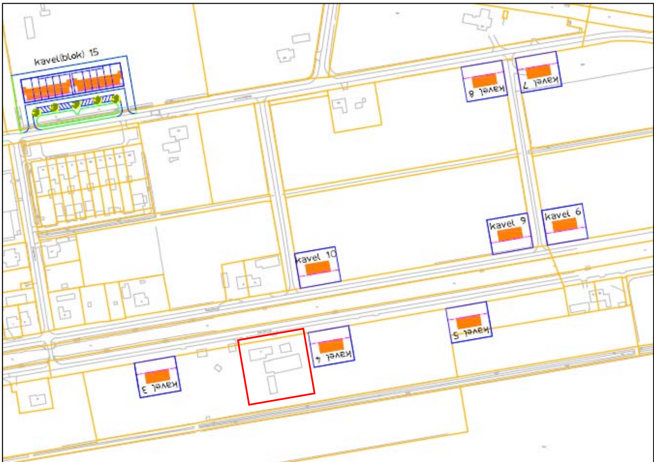
Afbeelding 3: Uitsnede verkavelingsituatie

Het (voormalige) terreingebruik ter plaatse van de bouwkvavels 3, 4 en 5 was voornamelijk akkerland.