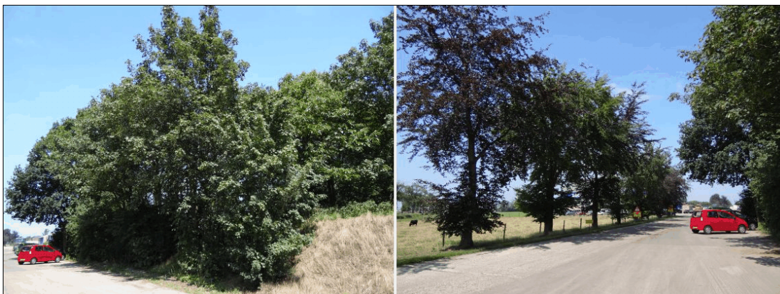
Afbeelding 2: Impressies van de houtkant en de laanbomen langs de bestaande inrit van loonbedrijf Kurstjens.

Ter plaatse van het nieuw te bouwen kantoor met parkeerplaats is momenteel verharding en een weide aanwezig die in gebruik is voor koeien. De nieuwe inrit, die gepland is aan de westzijde van het nieuwe kantoor en de al aanwezige loods, wordt aangebracht ter plaatse van een aanwezige akker en enige ruigte op een grondwal (zie afbeelding 3). Beschermde plantensoorten zijn hier niet waargenomen en zijn evenmin te verwachten, gezien het grondgebruik. Algemeen voorkomende zoodiersoorten (tabel 1, AMvB artikel 75; bijvoorbeeld konijn en haas) kunnen hier wel geschikt leefgebied vinden. De nieuwe bedrijfsruimte in het oostelijk deel van het plangebied wordt aangelegd ter plaatse van al aanwezige bouwwerken (silo's). Beschermde soorten zijn hier niet te verwachten.