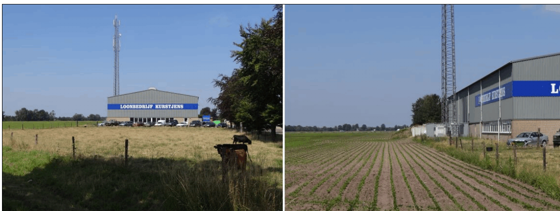
Afbeelding 3: Impressies van de locatie van het nieuwe kantoor en de nieuwe inrit van loonbedrijf Kurstjens.

Ter plaatse van het nieuw te bouwen kantoor met parkeerplaats is momenteel verharding en een weide aanwezig die in gebruik is voor koeien. De nieuwe inrit, die gepland is aan de westzijde van het nieuwe kantoor en de al aanwezige loods, wordt aangebracht ter plaatse van een aanwezige akker en enige ruigte op een grondwal (zie afbeelding 3). Beschermde plantensoorten zijn hier niet waargenomen en zijn evenmin te verwachten, gezien het grondgebruik. Algemeen voorkomende zoodiersoorten (tabel 1, AMvB artikel 75; bijvoorbeeld konijn en haas) kunnen hier wel geschikt leefgebied vinden. De nieuwe bedrijfsruimte in het oostelijk deel van het plangebied wordt aangelegd ter plaatse van al aanwezige bouwwerken (silo's). Beschermde soorten zijn hier niet te verwachten.