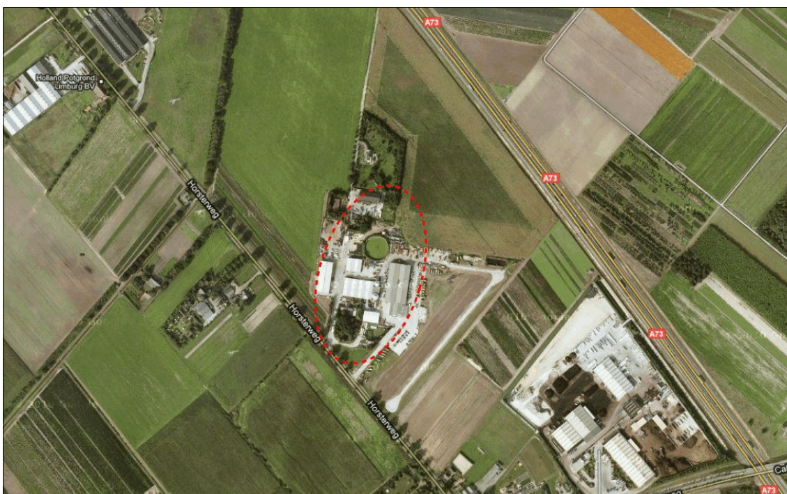
Abbeelding 1: Ligging van het loonbedrijf Kurstjens (bron luchtfoto: Google Maps).

Wat betreft de flora is het verboden om beschermde soorten uit te steken, te vernielen, te beschadigen of op enigerlei andere wijze van hun groeiplaats te verwijderen (artikel 8 Flora- en faunawet). Ten aanzien van de fauna geldt dat het verboden is beschermde dieren in hun natuurlijke leefomgeving te doden of te verwonden, opzettelijk te verontrusten of voortplantingsplaatsen (bijvoorbeeld nesten) te verstoren, te beschadigen of weg te nemen (artikel 9 t/m 13 Flora- en faunawet).