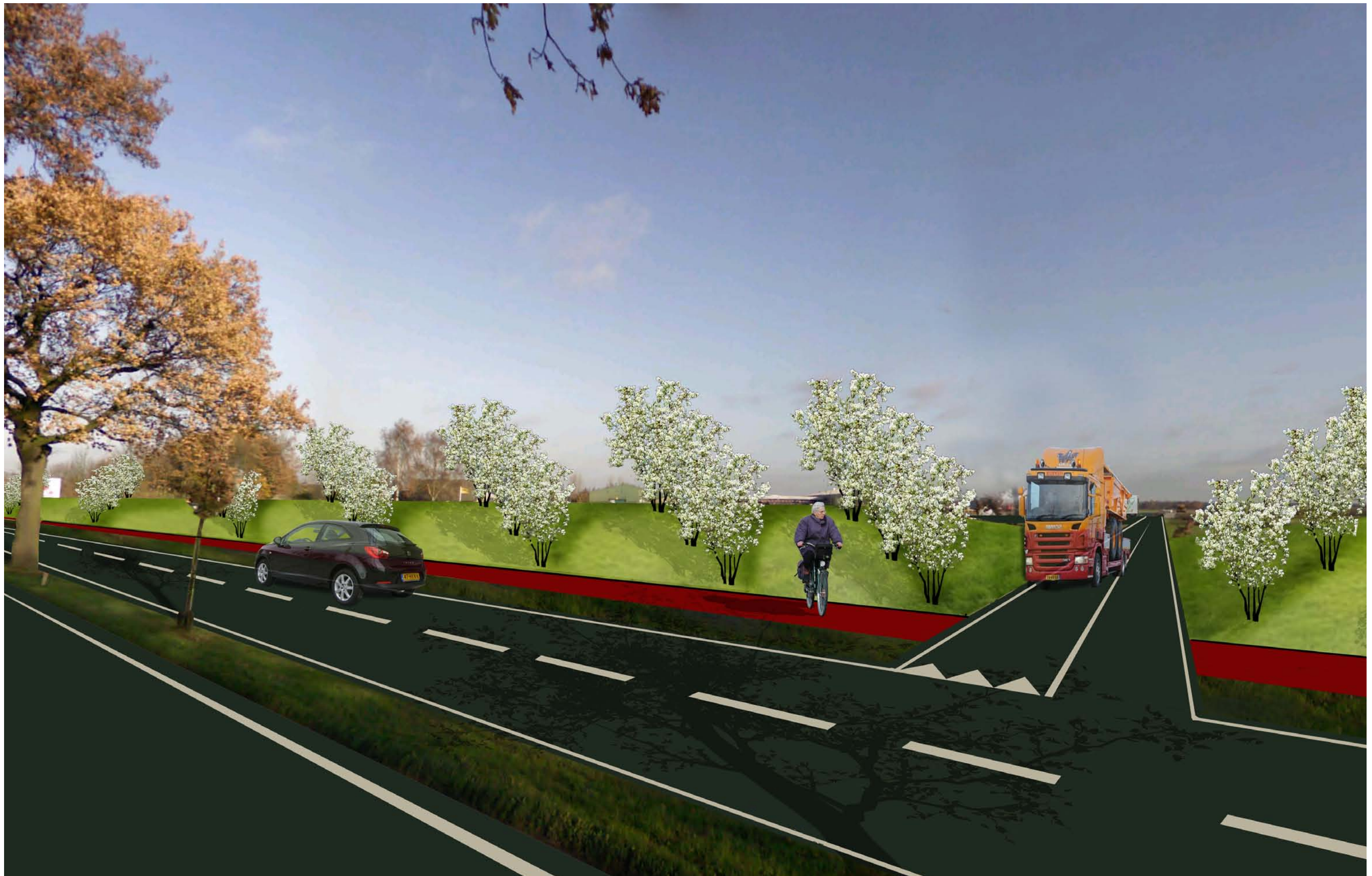
Schetsontwerp Klaver 11 Sfeercollage Horsterweg