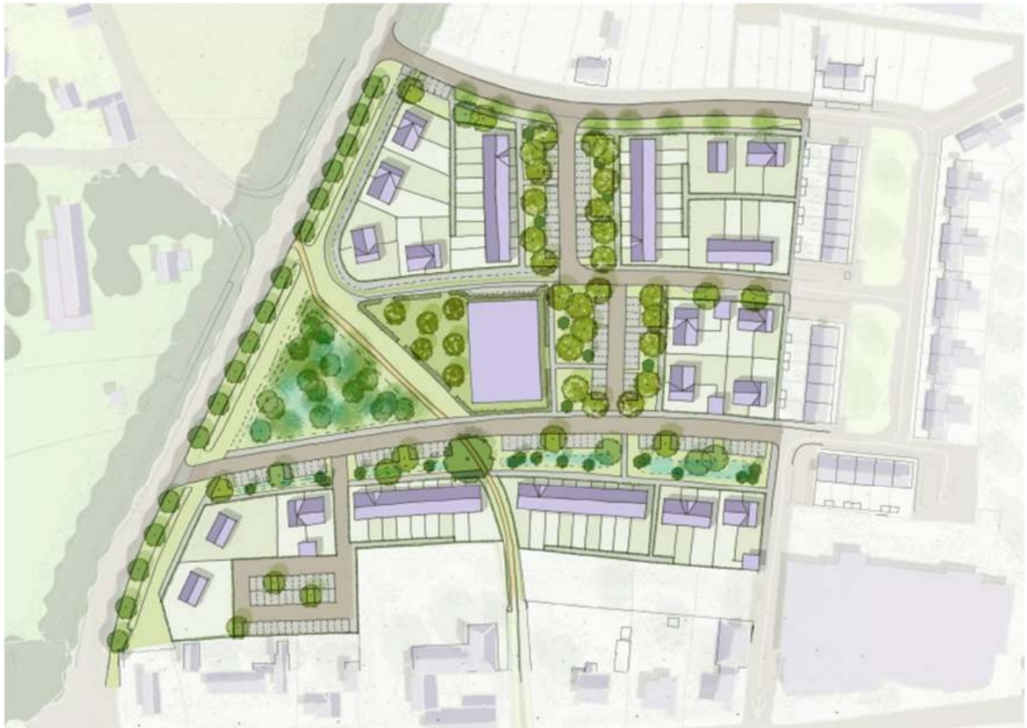
Afbeelding 2 Beoogde indeling plangebied