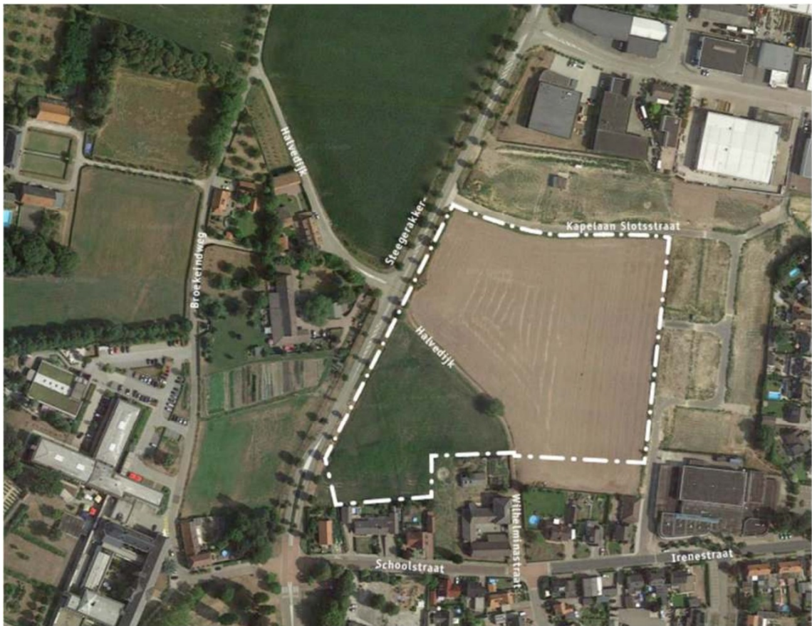
Afbeelding 1 Ligging plangebied (wit kader) en directe omgeving

Het plangebied wordt aan de noordzijde begrensd door de Kapelaan Slotsstraat en aan de westzijde en door de Steegerakkerweg. Ten oosten en zuiden wordt het plan begrensd door woonbestemmingen. Onderstaand is de globale ligging weergegeven.