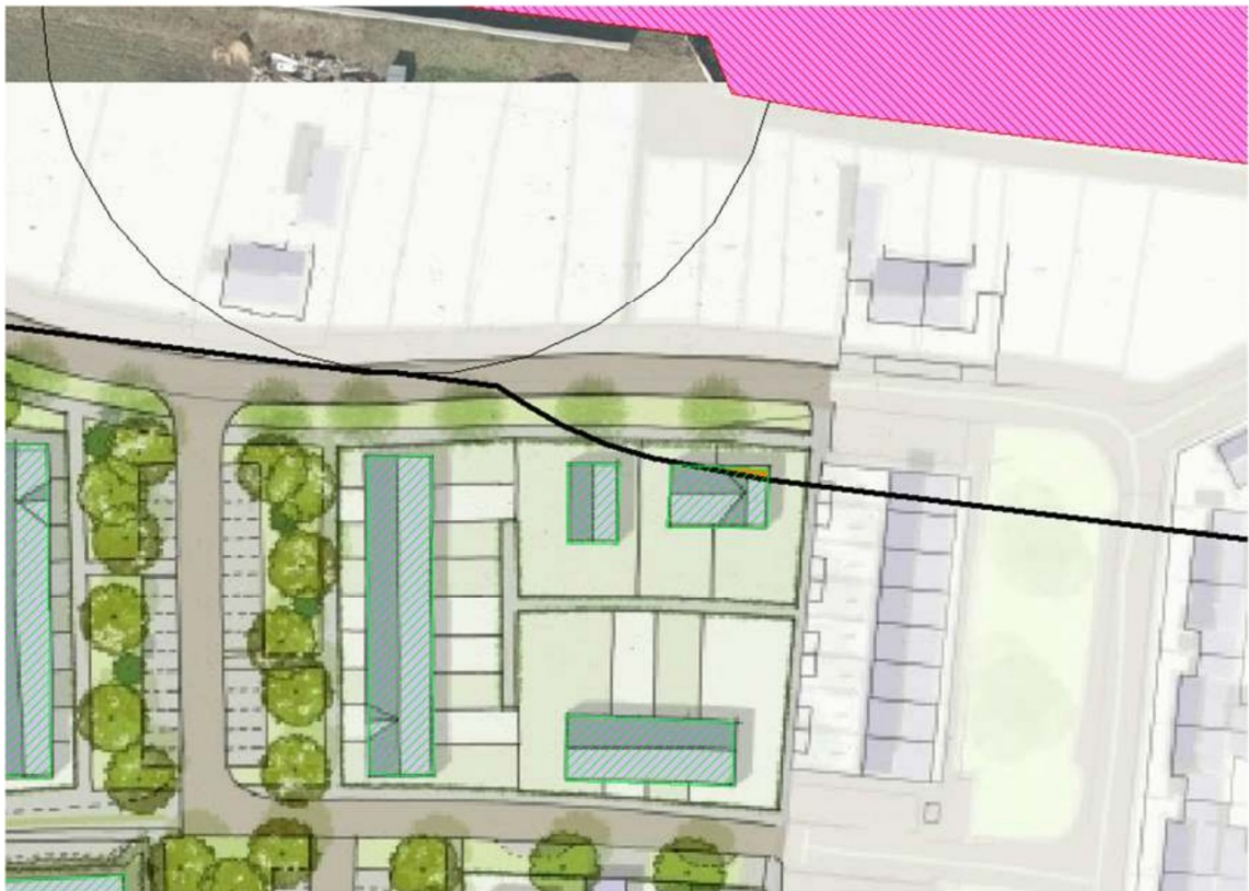
Afbeelding 4 Richtafstand t.o.v. woning binnen plangebied

Door de opdrachtgever is aangegeven dat deze woning verplaatst wordt, zodat deze buiten de richtafstanden ligt.