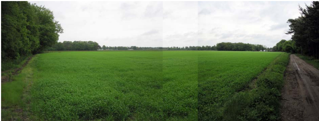
Figuur 3 Perceel L 534

Zowel de Meerlosebaan als de Brandakkerweg zijn landwegen in het buitengebied van Grubbenvorst. Het perceel zelf is bereikbaar via een onverhard pad.