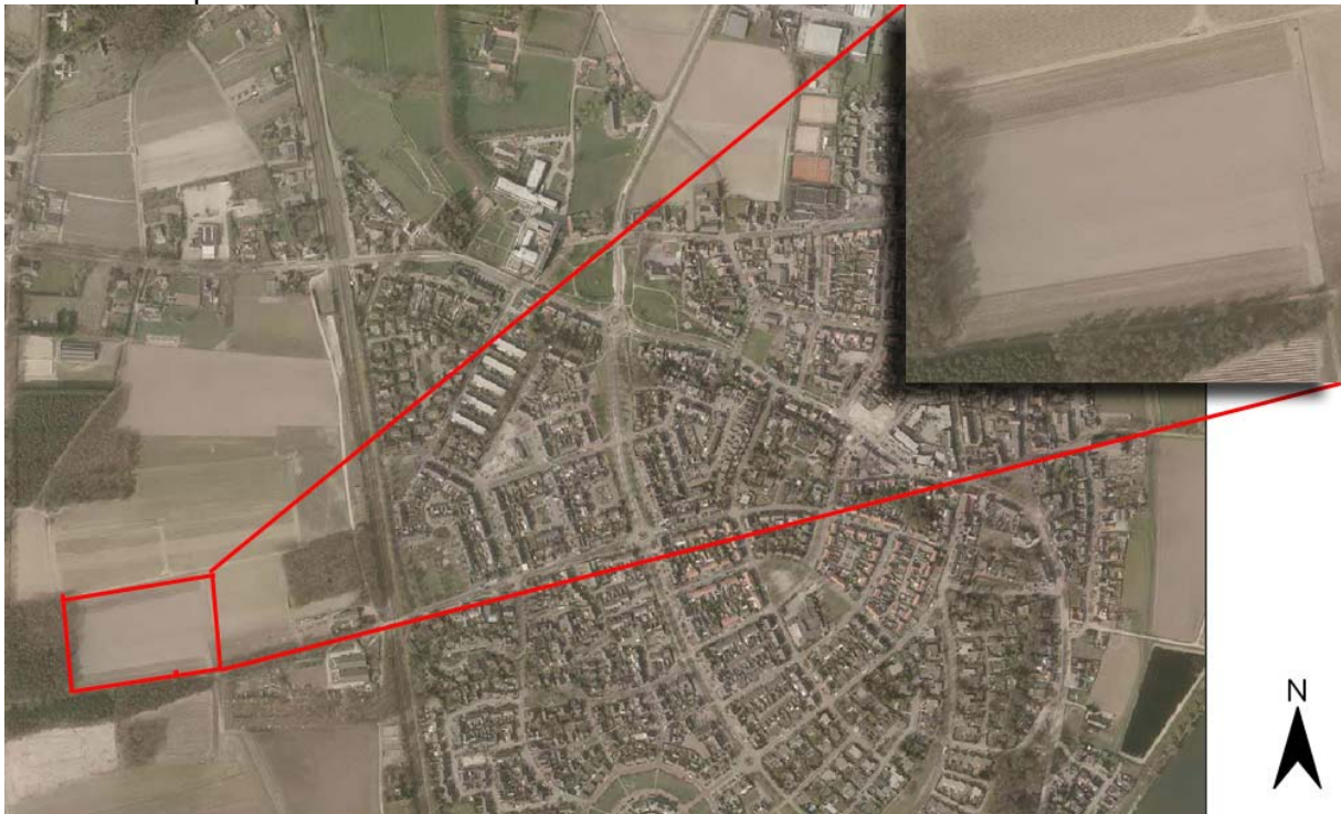
Figuur 1 Ligging plangebied

Het plangebied is gelegen westen van de kern Grubbenvorst tussen de Meerlosebaan en de Brandakkersweg. Het perceel wordt aan de oost- en noordzijde begrensd door landbouwpercelen en aan de zuid- en westzijde door bospercelen. Het perceel is in gebruik als landbouwperceel.