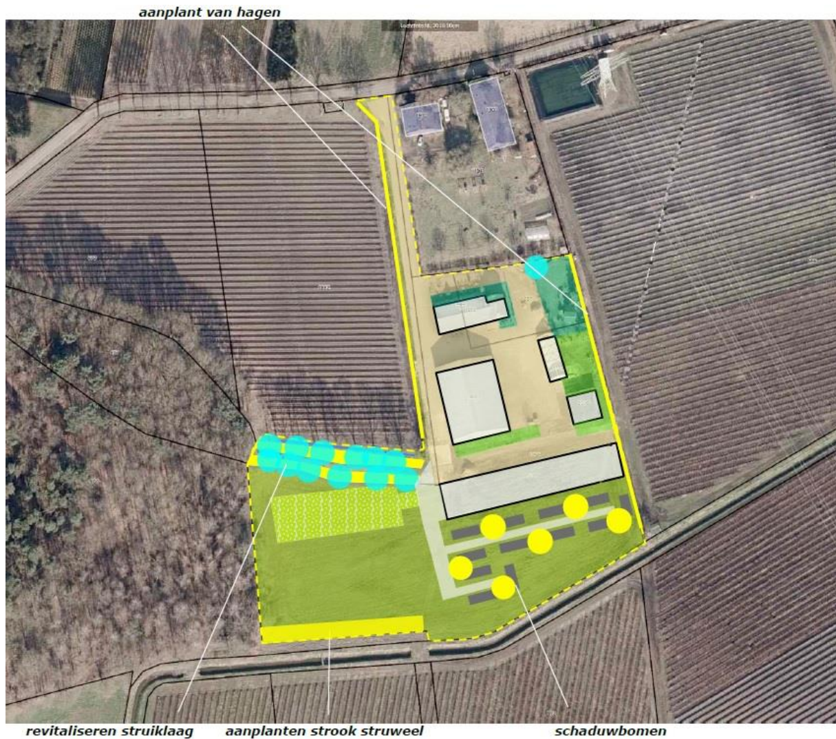
Figuur 3.3. De voorgestane situatie.