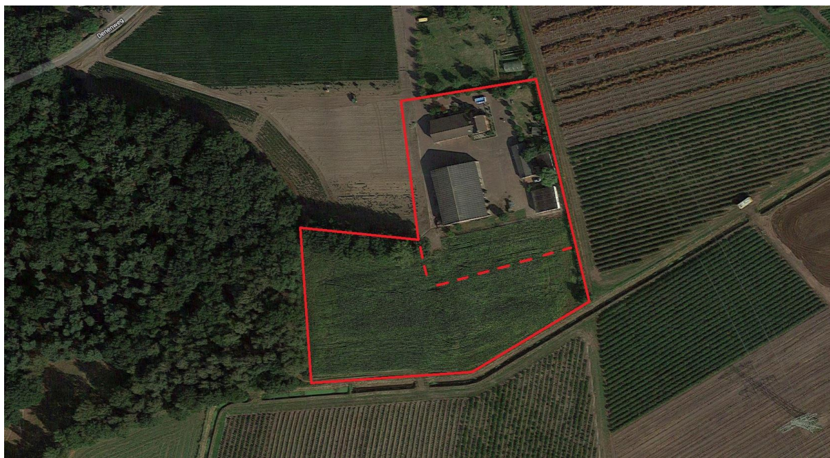
Figuur 4.1. Het plangebied (rood omlijnd).

Het plangebied is weergegeven in figuur 4.1. Het is gelegen ten zuiden van de dorpskern van Melderslo, in het buitengebied. De omgeving van het plangebied is landelijk ingericht. Ten zuiden van het plangebied ligt een sloot. Het plangebied zelf bestaat uit braakliggend terrein. Hierop is reeds een parkeerplaats (in het westen van het plangebied) aangelegd en er zijn 13 woonunits geplaatst met hiertussen een verharding. Aan de noordzijde van het plangebied ligt een dubbele houtsingel met zomereiken (zonder ondergroei). Tussen de bomenrijen ligt een verhard voetpad. Omdat de noordzijde (ten noorden van de stippellijn, zie figuur 4.1) ongemoeid blijft, valt dit feitelijk buiten het plangebied. In het plangebied zijn grassen en mossen aanwezig en soorten als vogelmuur en duizendblad.