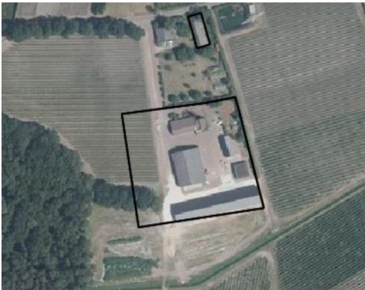
Figuur 3.1. Het huidige bouwvlak (zwart omlijnd).

De vorm van het huidige bouwvlak (zie figuur 3.1) wordt gewijzigd (zie figuur 3.2), zodat er achter de bestaande bebouwing de mogelijkheid is om arbeidsmigranten te huisvesten. Tijdens het veldbezoek waren er al 13 woonunits (zie kleine foto's voorzijde rapport) geplaatst (in januari 2019) en was er al een parkeerplaats aangelegd.