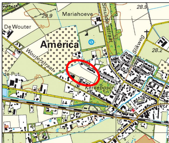
Figuur 1: Plangebied Wouterstraat fase 2