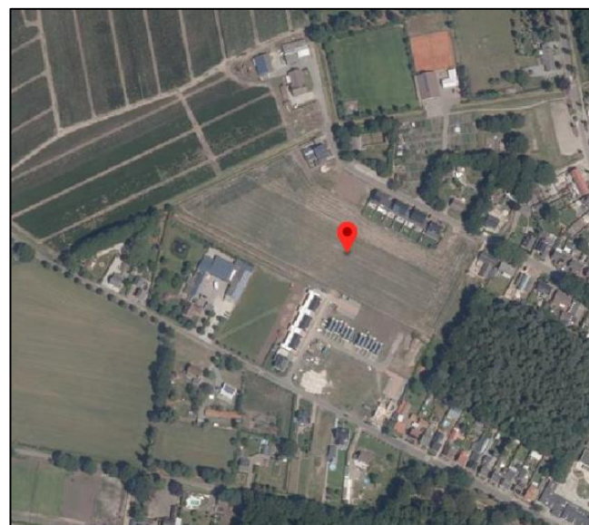
Figuur 2: Luchtfoto locatie