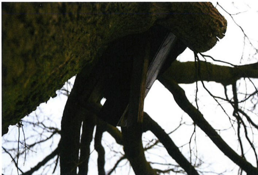
Figuur 4.2.1. 50 meter ten oosten van het plangebied bevindt zich een oude kapotte steenuilennestkast.

Mogelijk broeden er in het broedseizoen wel algemene vogels, zoals de veldleeuwerik, in de weidevegetatie.