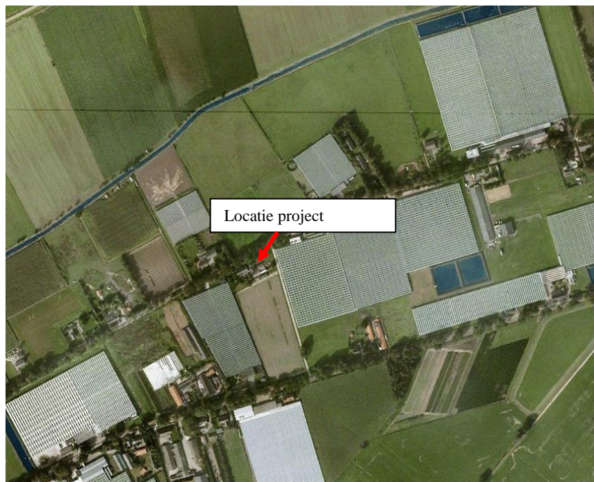
Figuur 1 De locatie

Locatie staat onder weergegeven, Hofweg 24.