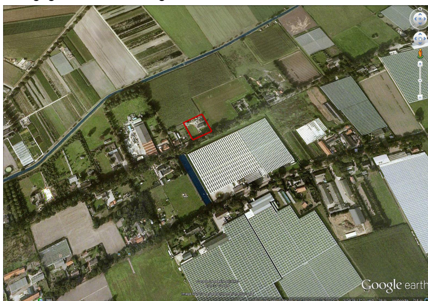
Afbeelding 1. Luchtfoto plangebied.

In het kader van deze wetgeving is er een natuurtoets verricht naar de voorkomende, dan wel te verwachten beschermde planten- en diersoorten binnen het plangebied. De ligging van het plangebied is weergegeven in afbeelding 1.