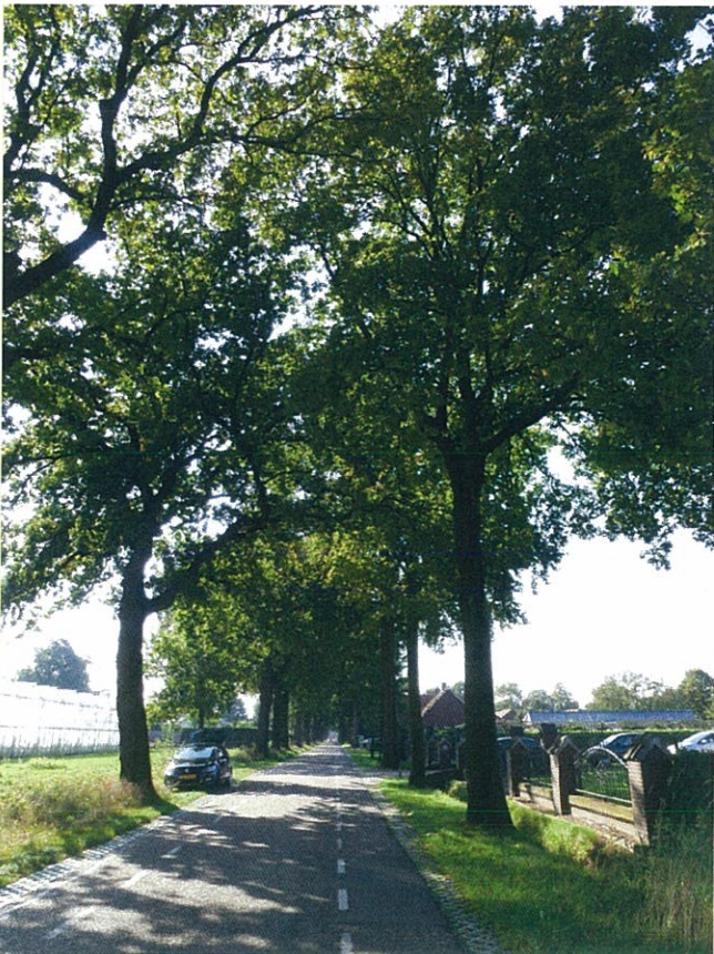
Afbeelding 1. Bomenlaan Hofweg.

Aan de zuidzijde van het perceel (straatzijde) is een erfafscheiding aanwezig bestaande uit gemetselde penanten met stalen sierhekwerk ertussen. De Hofweg zelf wordt begeleidt middels een bomenlaan en grasbermen. Deze zijde is landschappelijk ingepast.