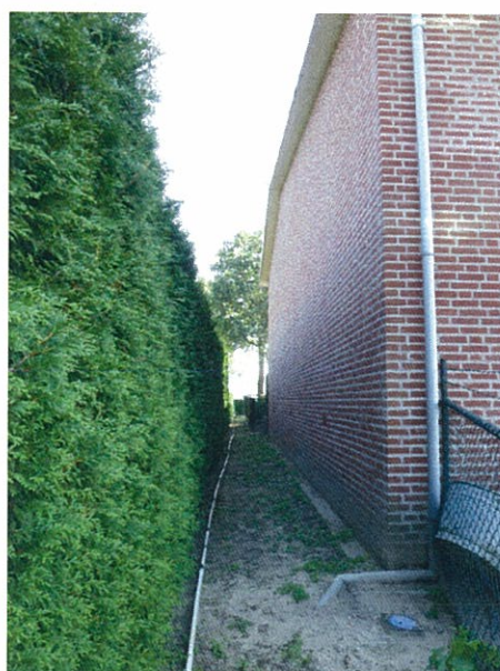
Afbeelding 6. Oostgrens, de haag t.p.v. bedrijfsbebouwing.