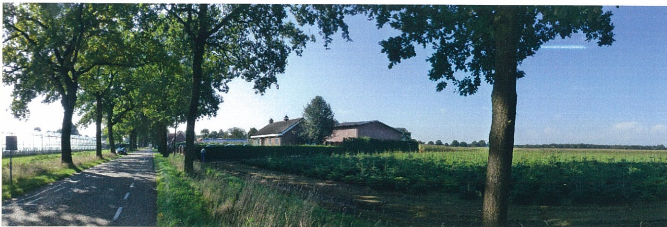
Afbeelding 4. Oostgrens