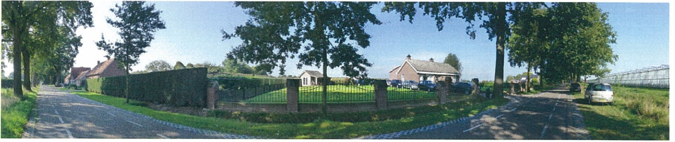
Afbeelding 2. Zuidgrens perceel.