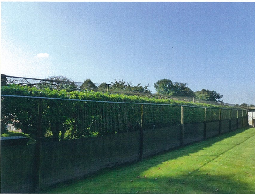
Afbeelding 3. Westgrens

De westgrens wordt begeleidt middels een haag van Laurierwilg, hoog 2\text{m}^1 . Deze grens is hiermee al ingepast.